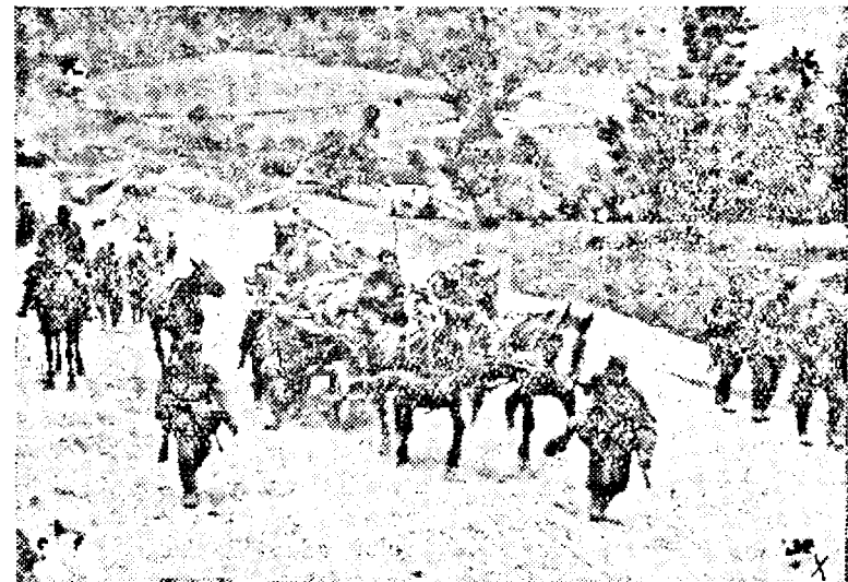
Înaintarea germană continuă pe frontul din Est cu toată starea mizerabilă a drumurilor sovietice.

nul de Richard Strauss, Hans Knappertsbusch, Clemens Krauss și Karl Böhm. În cadrul concertelor dirijate de maestrul Karl Böhm vor fi executate bucățile dedicate Filarmonicelei din Viena, cu prilejul acestui eveniment jubiliar. (RDV)