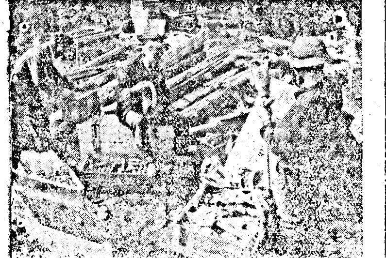
germane capturează o bogată pradă de munițiuni pe un aero-port sovietic.