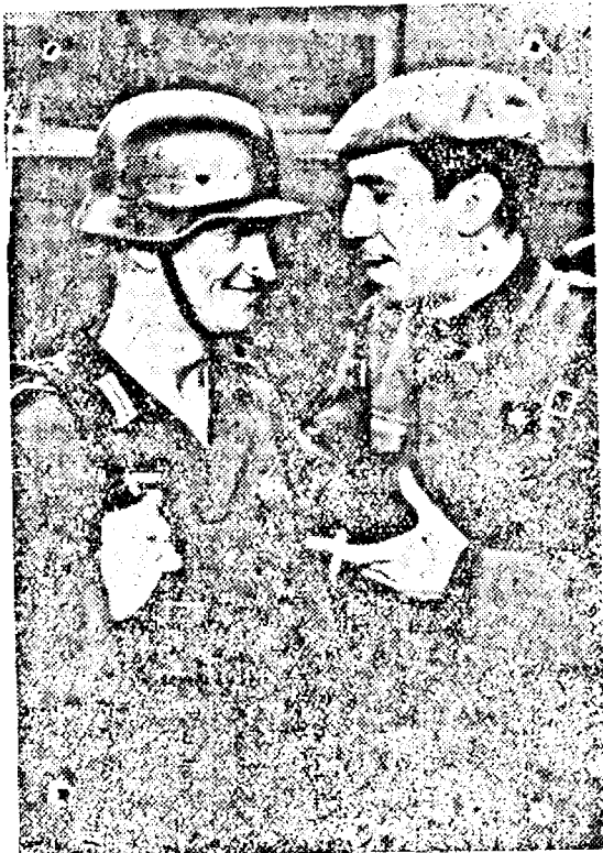
Un soldat german se întreține cordial cu un membru al diviziei albastre spaniole care participă la luptele de pe frontul din Est. (PK. Ob.)

„De pe pământul dezrobit, în mijlocul luptei pentru cruce și dreptate, îmi îndrept gândul către tot neamul nostru și tuturor le cer să sprijine statul în aceste ceasuri mari”. Deci, subscrieți la Impromutul Reîntregirii!