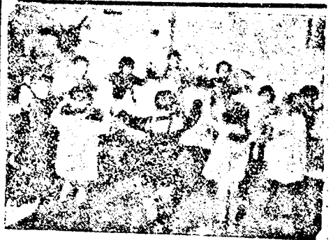
Aradi gyárüzem napközi otthon