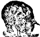
Neinte de folosintă.