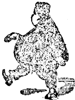
s'a îngrășat de 120 Kgr.