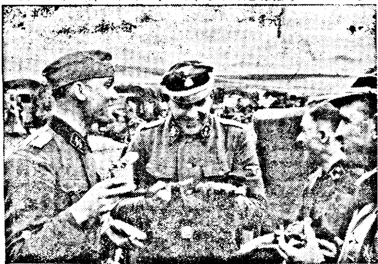
Soldatii germani in Grecia. Gustarea de dimineață

Germania, Waldhof A. G. a reușit însă, după lungi cercetări să evite acest inconvenient și să fabrice foite din celuloză, care vor satisface și cele mai exigente pretenții. • Este interesant de rețevat că, concernul Waldhof este interesat și într'o mare fabrică de celuloză de lângă Bordeaux (Franța), unde noule foite se vor fabrica în mari cantități. În această fabrică devitel se va încerca pe lângă obținerea foitelor și fabricarea celofibrilor. (RDV)