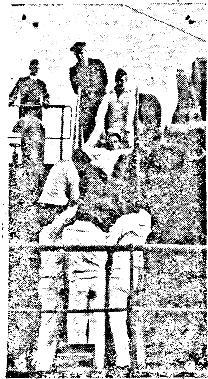
Pe bordul unui distrugător german. Un soldat englez rânit este transportat la spital