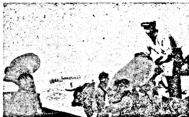
La gospodăriile Agricole de Stat strângerea recoltei este în toi.