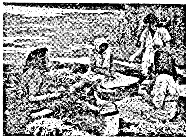
Dacă lipsesc saci la batoze, apoi vă ajutăm noi... La Iratoșul Mic ufederistele repară sacii prin muncă voluntară.