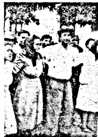
Să ne bucurăm din inimă! Doar și noi ne-am ajutat Patria. La Rovine în fața „Centrului” s'a încins hora... |