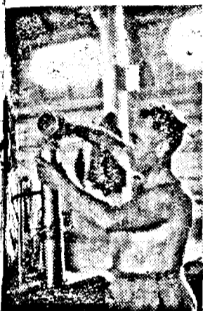
Grâul a ajuns la „centru” — La Comcereal din Curtici, cotelelor li se stabilește greutatea hectolitrică.