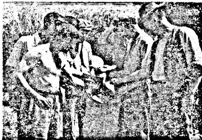
Apoi dacă lucră bine pământul și mai bagi și mașinile pe holde, nu-ți de mirare că scoți rod bun — își zic muncitorii Gospodăriei de Stat „Scânteia”, admirând grâul din noua recoltă.