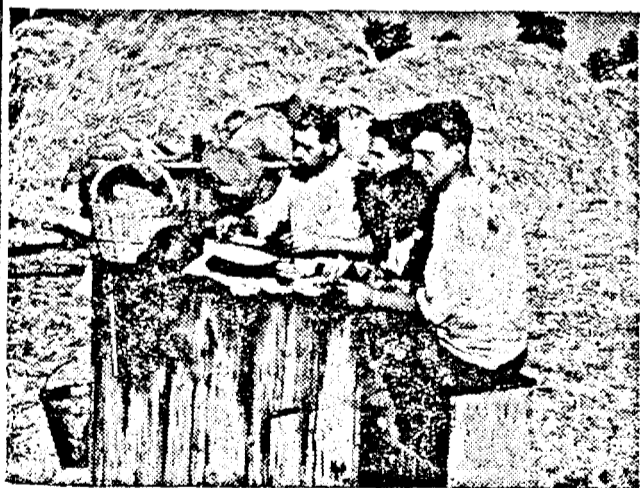
Soarele a ajuns la zenit... S'a oprit și batoza pentru scurtă vreme... Muncitorii dela o batoză din Variaș în timpul prânzului.