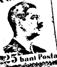
25 bani Posta