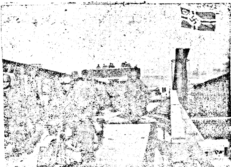
Coloane germane trecând în Bulgaria pe podul construit de pionierii germani

Pardesiuri, haine, HOSZPODAR magazin: curăț și vopsește Eminescu 3 Întreprinderea: Stroescu 10 Împregnam paltocane baion