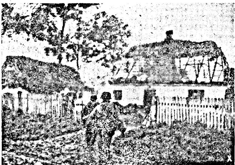
O baterie germană în drum spre inima Rusiei. (Pk. Ob.)

Platoane de prizonieri lucrează pe terenurile de aterizare la construcția barajelor împotriva zăpezii, necesare în ipoteza, când zăpada va cădea din abundență. Au fost depozitate din vreme cantități mari de lemn de zăpadă. Cea mai bine organizată și cea mai modernă armată din lume a luat din vreme toate măsurile, pentru a înlătura toate neajunsurile cauzate de iernii. Toată lumea colaborează la această operă: disciplina fiecărui soldat, organizația Todt, serviciul muncii voluntare și milioanele de prizonieri. Desigur că, mai rămân încă multe greutăți, dar nici dușmanul nu poate spera că, în săptămânile ce urmează, va avea parte de o vreme ca în luna lui cuplor. Nimeni nu-și face vre-o iluzie falsă atunci, când afirmă că, greutățile iernii vor fi mai greu de suportat de sovietici decât de germani. Această, fără să fim seamă de situația disperată, în care se află armatele încercuite la Leningrad. Problema aprovizionării este cât se poate de importantă pentru o armată modernă. S'a putut vedea, căl de puțin a fost pregătit comandamentul sovietic în această privință și cum acest comandament n'a știut să tragă profit nici de timpul frumos de astă vară. Nu-ți trebuie prea multă fantezie pentru a avea imaginea desorganizării, care domnește în lagărul dușman.