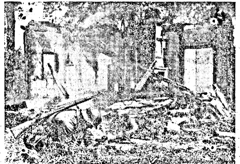
În toată lupta, un telefonist german reface linia întreruptă.