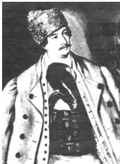
Avram Iancu în timpul revoluției de la 1848

„...La un târg din Hălmagiu, Iancu este arestat... Moșii înconjoară soldații, eliberându-l. Împăratul trimite ordin pentru oprirea execuțiilor și arestărilor...” În 1850, Împăratul Austriei și cel al Rusiei trimit decorații pentru mulți prefecți și tribuni... „Iancu primește de la nemți Ordinul Leopold, clasa a III-a, iar din partea rușilor Ordinul Sfânta Elena, clasa a II-a...” Iancu le refuză. „...În același an au plecat la Curtea Imperială: A. T. Laurian, Maiorescu, Bărnăuțiu, prefectul Iancu și alții. Nu au fost primiți în audiență, ordonându-li-se să părăsească Viena în 24 de ore...” Prefectul de poliție al Vienei l-a întrebat pe Iancu de ce a refuzat decorațiile de la doi împărați? Iancu a răspuns: „Nu m-am luptat pentru decorații, ci pentru drepturile poporului român.” În 6-18 iunie a fost publicată ștergerea iobăgiei. 35