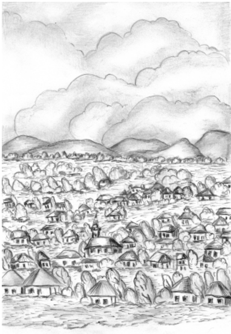
Pirciș și Jeieni sub furia apelor