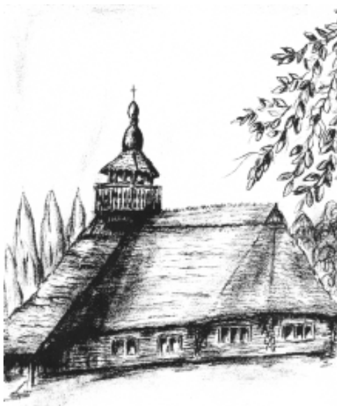
Biserica din Pirciș-Jeieni – sec. XVII

Au intrat. Bărbații în față, femeile mai în spate. Îngenuncheară. Ana și Lena, nevasta lui Mitru, cu cele două fiice ale ei. Nemișcate cum stăteau în genunchi, cu mâinile împreunate a rugăciune și ochii ridicați spre icoanele de pe iconostas, păreau un sfânt grup statuar dăltuit în marmură albă.