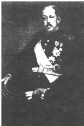
Antoniu Mocioni de Foen. marele Maestru al Vânătorilor Regale

Curtea boierului George freamătă de viață. Se înmulțiseră hambarele, grajdurile. Fel de fel de anexe gospodărești se prăvăleau în șir pe coastă de la pădure și până jos, la intrarea de la „Drumul Făgetului”. Caterina este mândră de parcul castelului din Căpâlnaș, prin care se zbenguie iepuri, vulpi și alte animale aproape domestice. El are în spatele castelului un parc natural, pădurea care se întinde pe sute de iugăre până la hotarul Făgetului. Despre animale, ce să mai vorbim? Săgetează peste cărări mai la tot pasul. Cristalul pâraielor oglindește în fapt de seară ciutele, întregind mirificul tablou al codrului. Ele, ciutele, adăpându-se, sunt ținte sigure în fața vânătorului. El nu trăgea niciodată în ele când beau apă. Ar fi o crimă. Ca un cuțit împlântat fără de veste în spatele cuiva. Animalele trebuie doborâte în mișcare. Adevărata luptă pentru