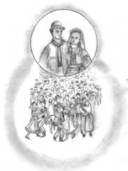
Nuntă în sat

Nașa n-a avut grijă, ice – A făcut tortul ăsta, ice, pe care îl dăruiește mirilor, pentru a-l mânca sănătoși.