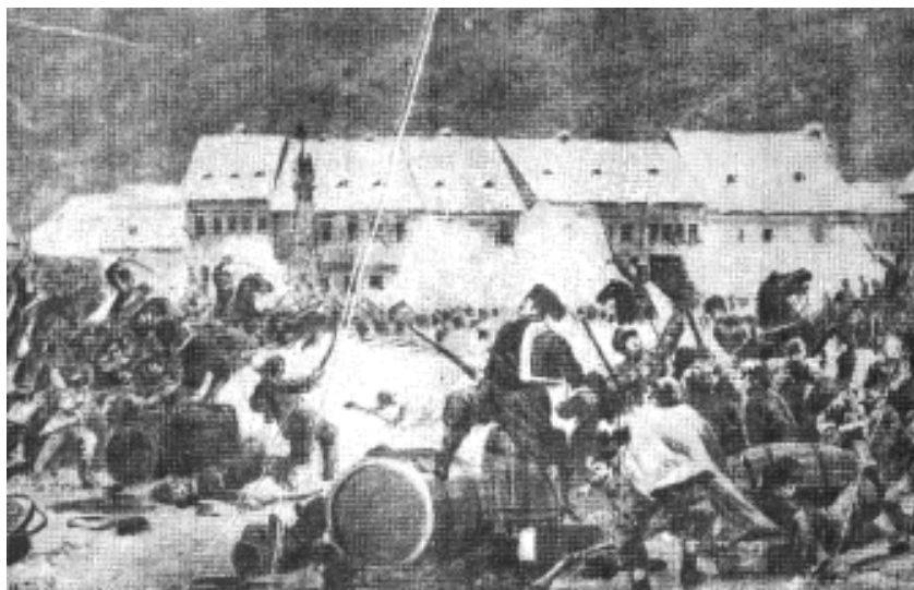
Lupte de stradă la Arad (8 februarie 1849)

Vremuri tot mai tulburi peste Imperiul Austro-Ungar. Minerii, iobagi din Apuseni, sub conducerea Ecaterinei Varga, amenință prin ridicarea la luptă. Eftimie Murgu încearcă să mobilizeze țărani din Banat pentru luptă, pentru emancipare și împroprietărire. Este închis la Pesta. Încă din 1821 Imperiul este guvernat în mod absolutist. Se întăresc organele de represiune. Nobilimea maghiară încearcă să impună ca limbă oficială – maghiara. Simion Bărnuțiu ripostează prin scrierea: „O tocmeală de rușine și o lege nedreaptă”. La Pesta se publică „Programul Revoluției”, pentru constituirea unui Stat Maghiar, independent de Austria, negând dreptul de existență națională a românilor. O serie de reprezentanți maghiari au recunoscut justetea cauzei românilor, dorind realizarea unității de acțiune româno-maghiare. Relațiile de neîncredere se sfârșesc tragic. Contactele româno-maghiare vor fi stabilite de Nicolae Bălcescu. Sub presiunile armatelor ruso-austriece, se semnează „Proiectul de Pacificație”, recunoscându-se dreptul românilor pentru formarea Legiunii ce viza crearea Statului Mod-