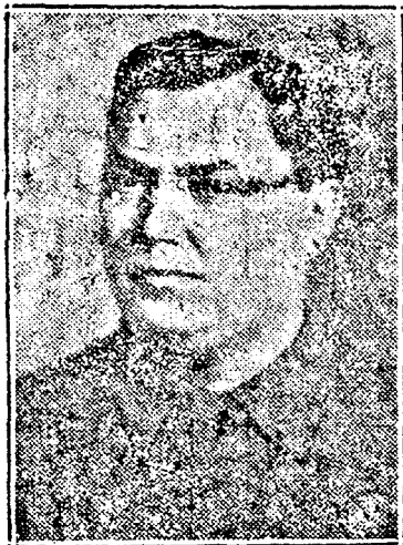
G. M. MALENKOV

baráti Magyar Népköztársaság van; a Szovjetunióval szemben ellenséges Románia helyett a baráti Román Népköztársaság; a régi Bulgária he-