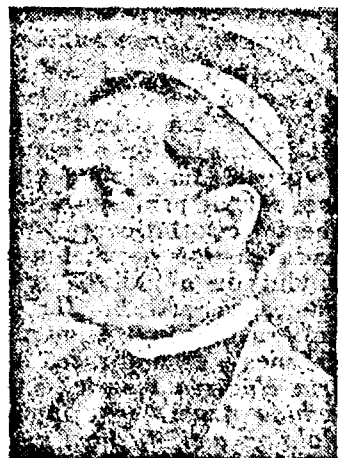
P. S. Sa Episcopul dr. I. Hossu președinte de onoare al Comitetului Regional pentru Transilvania al Ligii.

Tratatul nostru primar este cu Domnul ROMĂNI, SĂ-I PĂSTRĂM CREDINȚA. Cluj, la 12 Mai 1935.