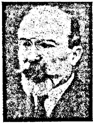
† Louis Barthou fost ministru de externe al Franței, ce- tățean de onoare al României, asasinat mișelește la Marsilia de atentatorii dela Janka Pusztá.