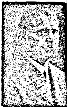
† Vasile Goldis

fost președinte de onoare al Com. Regional pentru Transilvania al