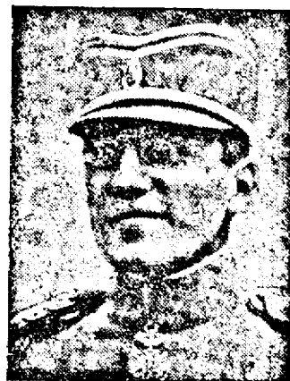
† Marele Rege Alexandru al Jugoslaviei, asasinat mișelește de aten- tatorii dela Janka-Pusztá la Marsilia.

Biserica și-a început a- postolia acolo, unde ea are un rol unic de avangardă, menită să deschidă porțile zăvorite ale sufletelor chi- nuite. E momentul să vie suveranitatea națională cu instituțiile și mijloacele ei multiple, spre a da — după un plan mare și de lungă durată — toată amploarea cuvenită, unei asemenea o- pere istorice, de integrare în patrimoniul etern al ra- sei noastre.