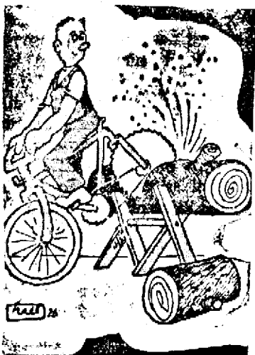
Asul pedalei își taie lemnule...

— Domnul care umblă și el să învețe cum se joacă pe domnește, ar face bine dacă nu s'ar supăra, când îi ia, unul și altul partenera. Căci vezi, până învață el, ea ce să facă săraca? Să priviască? Nu se poate! Așa că domnul să se mai „innoaic” puțin, c'altfel se poate întâmpla să rămână fără ea!