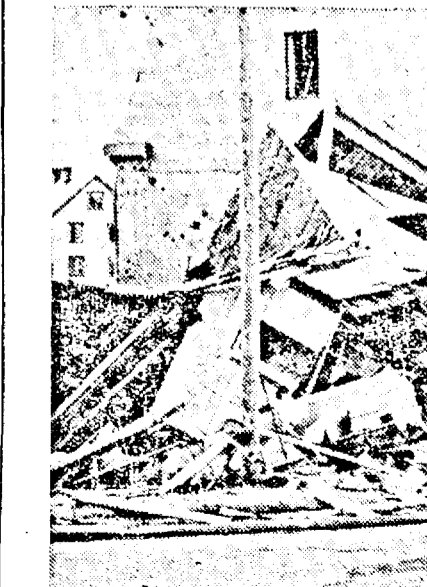
UN ORAȘ GERMAN DUPA UN BOMBARDAMENT GERMAN