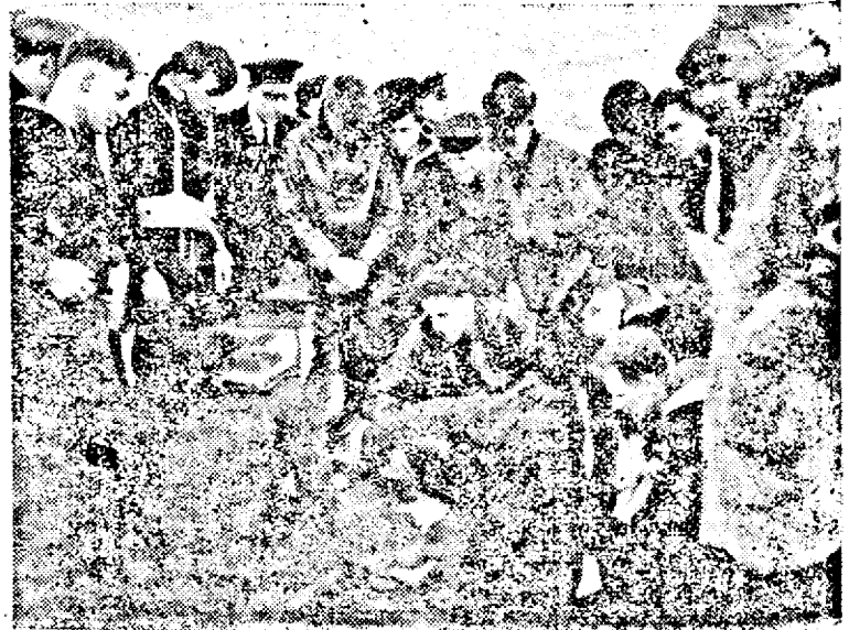
Unui marinar german după ce a fost salvat i se face respirație artificială