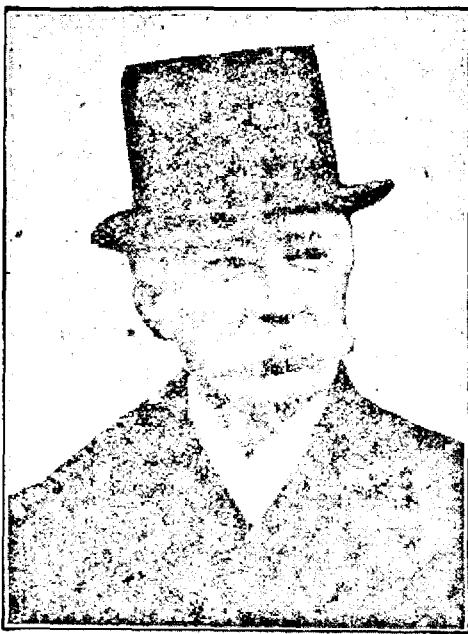
Regentul Gheorghe Buzdugan

În urmarea acestui decret apărut în ediție specială în „Monitorul Oficial”, Corpurile Legiuitoare se convoacă pentru 9 Oct., orele 10 a. m., într-o singură Adunare ca reprezentanță națională spre a alege un al treilea membru Regent, în locul decedatului membru în Regență, Gh. Buzdugan.