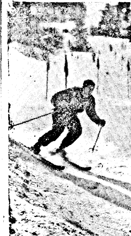
Cursă de slalom la Garmisch-Partenkirchen