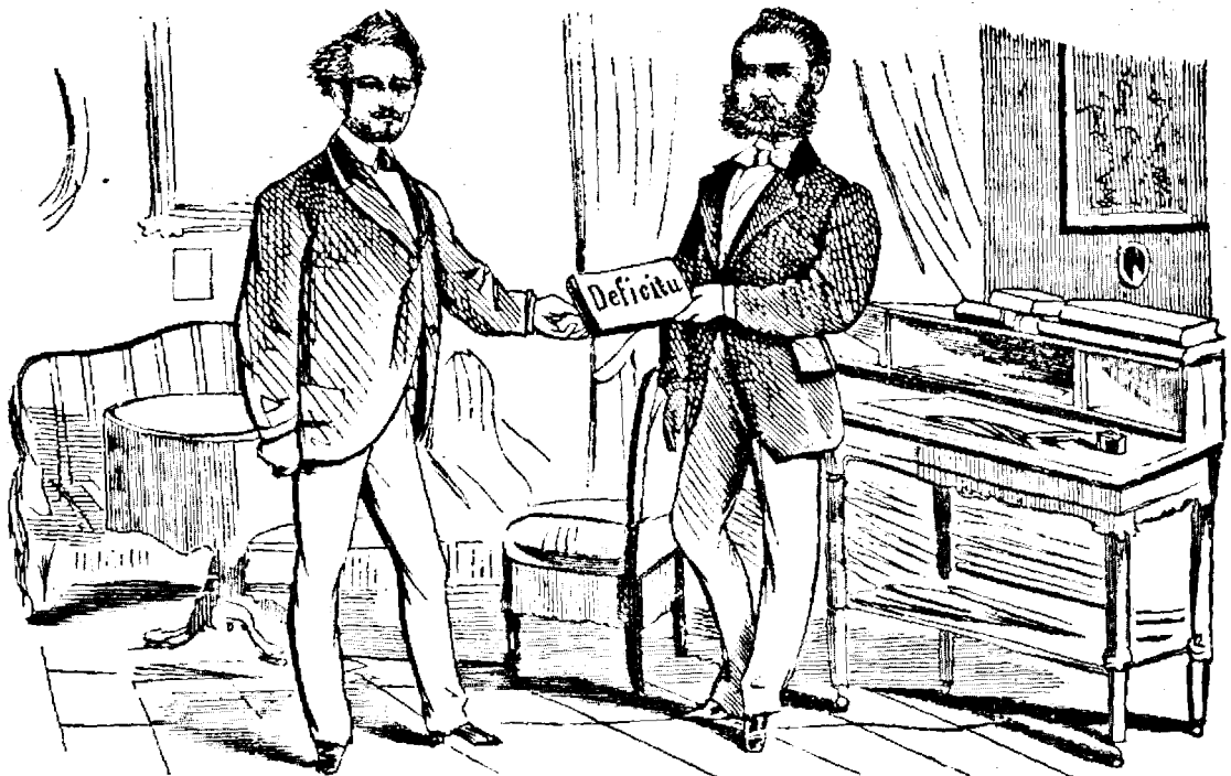
Fostulu ministru-redactoru predă portfoiulu urmatoriului seu, cantandu :

Frunda verde, lemnu uscatu, Facu-mi cruce c'am scapatu !