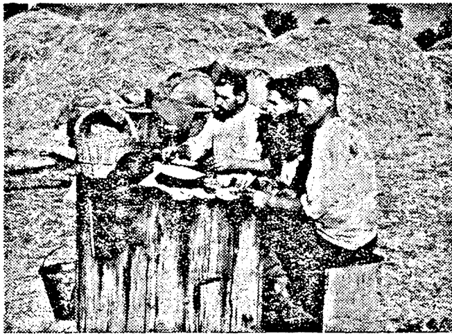
EBÉDELNEK A VARJASI CSEPLŐMUNKÁSOK A fáradságos munka után jól esik az étel

Összefoglalva a fenti tanulságokat, az elkövetkezendő feladatok is pontosan megjelölhetők. Ahol éleves a pártélet, ahol a pártszervezet szoros kapcsolatban áll a falu életével, ahol helyes nevelő és oktató munka folyik, ott nagyszerű eredmények mutatkoztak. A Párt a dolgozó-tömegek élcsapata. Ezt a feladatot úgy töltheti be, hogy minőségi politikai munkára helyezi a hangsúlyt. Aradmegyei helyi pártszervezeteink a nyári mezőgazdasági kampány során gyűjtött tapasztalatokból; az eredményekből és hiányosságokból le kell szűrjék a tapasztalatokat és az őszi, majd a téli folyamán minden erejükkel a pártélet megélénkítésén kell dolgozzanak. Láthatták, hogy ahol a pártmunka nem volt gépies, hanem a való élettel szoros kapcsolatot tartott fenn, ott nagy volt az érdeklődés. A verifikálás azt is behizonyította, hogy a pártönkivüli becsületes dolgozók milyen érdeklődéssel tekintenek a Párt felé. A verifikálási üléseken résztvevő pártönkivüli dolgozók Pártunk iránti szeretetből, megbecsülésből lettek tanulságosak. A jól működő pártszervezet valóban minden dolgozó vezetője, tehát a pártmunkát meg kell javítanunk minőségileg. Hozzájárul e feladat teljesítéséhez a verifikálás munkája, amely megtisztítja sorainkat az oda nem való elemektől és így egészségesebbé teszi a pártéletet. Rendszeresség, tervszerűség és minden feladat politikai megoldása: ez az a mód szer, amely a pártmunka minőségét megjavítja és Pártunk helyi szervezeteit még erősebbé, munkájukat pedig még eredményesebbé teszi.