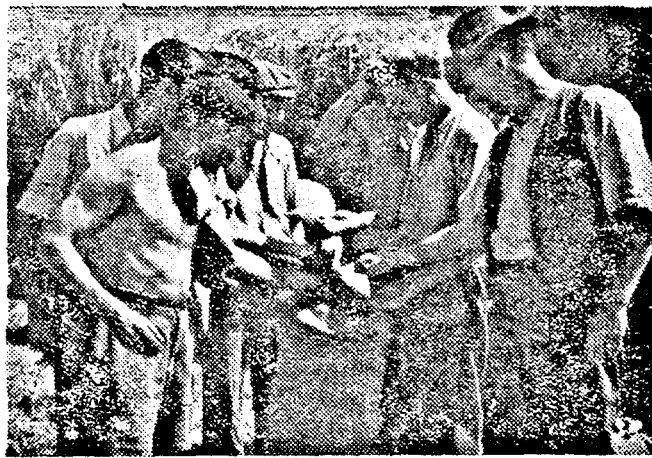
EZ AZTÁN A JÓ BUZA I A „Szikra” állami gazdaság dolgozói büszkék a jó termésre