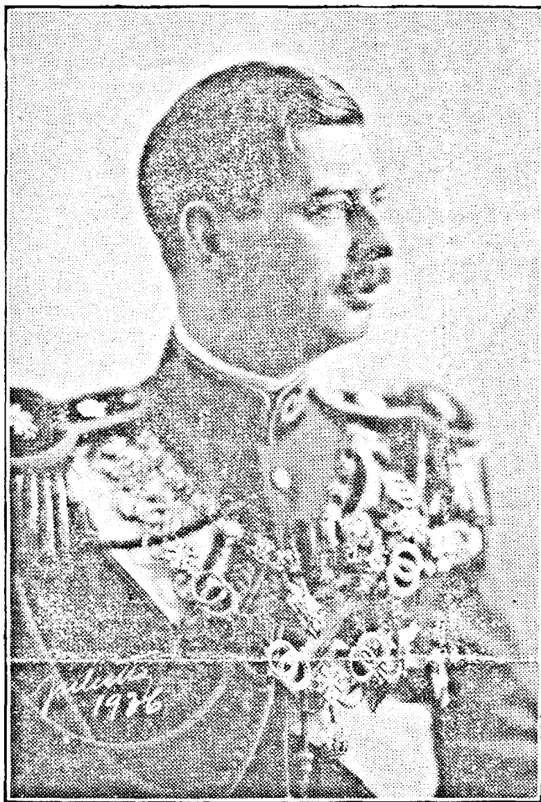
M. S. Regele Carol al II-lea