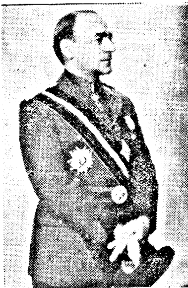
D. Armand Călinescu