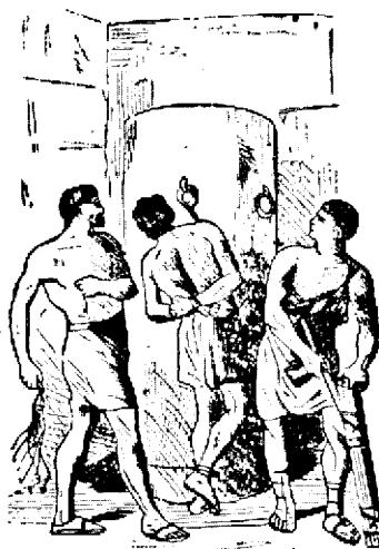
Așa era chinuit un osândit

Se spune că lumea aceasta văzută este și ea o oglindă minunată, în care noi îl putem vedea pe Dumnezeu. Dar această oglindă încă nu e gata. Numai din oglinda lumii, oamenii nu L-ar fi putut vedea niciodată pe Dumnezeu în toată splendoarea și măreția și mai ales în dragostea Lui. Ii Ipsea și acestei oglinzi „smalțul cel roșu”. Și acest „smalț roșu” e sângele Domnului Isus, vărsat la crucea Golgotei, prin care noi putem vedea pe