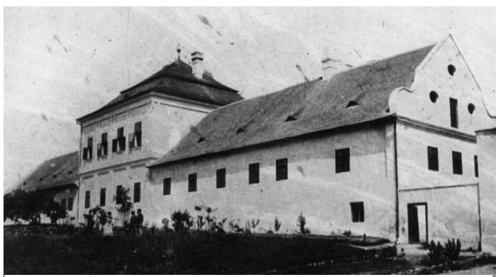
Localul vechii Școli Viticole din Miniș

Pe domeniul erariului din Miniș exista încă din anul 1835 o vie model pe lângă pivnița castelului, unde localnicii dar și alți viticultori din podgorie și-au însușit cunoștințe utile de vinificație. Această oportunitate a stat la originea demersurilor făcute în presa arădeană de către viticultori între anii 1870-1874 pentru înființarea școlii. Reacția forurilor administrative nu a fost cea mai promptă, trebuind să treacă zece ani până la primirea aprobării de înființare a instituției. Un aport decisiv la această rezoluție a fost adus de către intervențiile succesive către autorități ale marilor proprietari de vii și comercianți de vinuri grupați în Asociația Economică din Arad; ei urmăreau la rândul lor mărirea profiturilor prin practicarea unei viticulturi cu oameni școliți: vințălerii. Ca urmare a presiunilor constante ale sătenilor și ale marilor proprietari de vii, statul a renunțat în anul 1880 la ideea vânzării castelului și a viei de la Miniș. El le-a cedat Ministerului Agriculturii cu destinație specială pentru deschiderea de urgență a Școlii Viticole 44 . La 1 octombrie 1881 au început în mod oficial cursurile cu 24 de