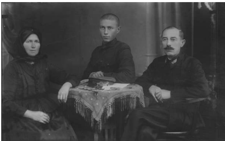
Familie din Miniș

Perechile căsătorite erau simbolul echilibrului și statorniciei comunității satești din Miniș, al simțului civic și al moralității. Numărul perechilor cununate se situa între 269 în anul 1883 și 351 în anul 1906. Numărul perechilor căsătorite se raporta anual de către preot la Episcopie, el reprezentând