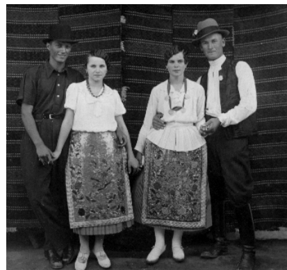
Costume populare de tranziție - 1939

În zilele noastre a dispărut tradiția proiectării și confecționării costumelor populare cât și obiceiul purtării lor pe care îl întâlnim doar sporadic, festivist, cu ocazia manifestări sau spectacole cu caracter folcloric.