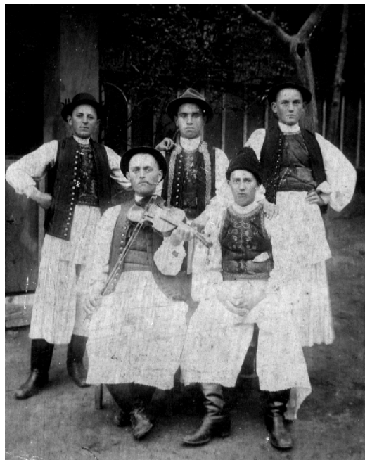
Muzicanți ai satului

Jocul era un eveniment la care asistau părinții tinerilor, rudele cât și alți oameni din sat. Un moment important din viața fiecărui tânăr era intratul în joc, care era regizat între cea sau cel care intra și un tânăr sau o tânără ce erau deja intrați în joc (inițiații). Se considera ca intrat în joc tânărul care dansa trei dansuri consecutive cu partenerul său care era deja intrat în joc. Fetele erau băgate în joc în general de la vârsta de 14-15 ani de către tânărul care îi făcea curte sau de către o rudă. Uneori se întâmpla ca fata să fie scoasă din joc de către partener, care o întorcea pe sub mână în timpul primului dans și apoi îi dădea drumul, după care muzica cânta marșul. Și acest moment era aranjat în prealabil între feciori și muzică. Nici o fată nu rămânea nebăgată în joc deoarece după scosul din joc venea un alt băiat și o lua la dans, reintroducând-o astfel în joc. Atmosfera de la jocul minișenilor a fost întotdeauna pașnică, fapt pentru care veneau adeseori feciori din satele vecine Sâmbăteni, Cladova, Păuliș, Cuvin și Ghioroc.