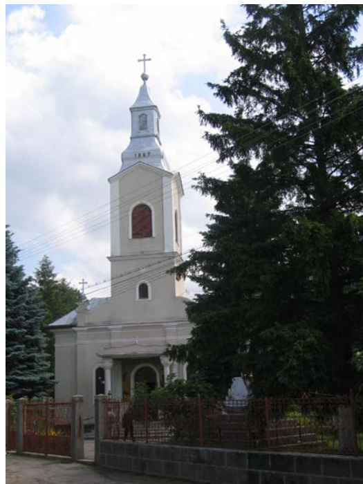
Clădirea noii biserici

La Miniș, în biblioteca parohială existau trei cărți bisericești din secolul al XVIII-lea, tipărite la Râmnic: „Liturgierul” din 1759, „Moliftelnicul” din 1768, și „Psaltirea” din 1791. Toate au fost scrise cu caractere chirilice și sunt legate în piele. De la începutul secolului al XIX-lea existau alte trei lucrări editate la Buda: „Despre deatorințele