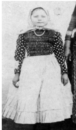
Costume populare ale copiilor

miniatură. Ca întotdeauna fetele erau îmbrăcate mai cochet de către mamele lor, cu batic, bluză, rochie și cătrânță de mătase, la gât cu galbeni sau mărgelile iar în picioare cu ghete 150 .