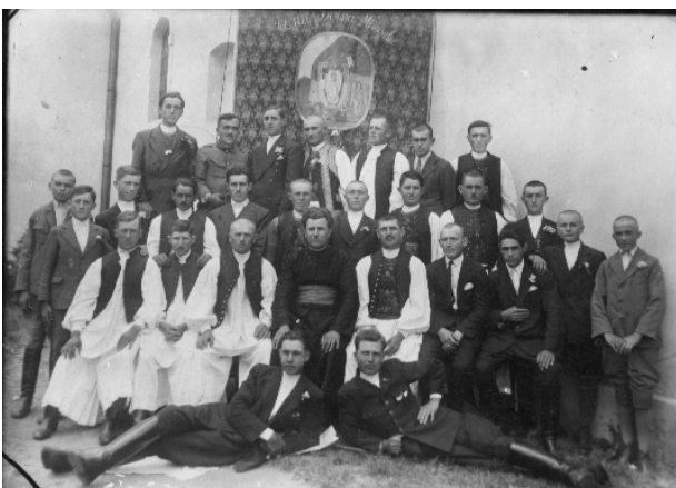
Corul „Doina Minișului” 1933

secolului al XX-lea, când învățătorul Traian Fridrich dirija corul bisericesc mixt al