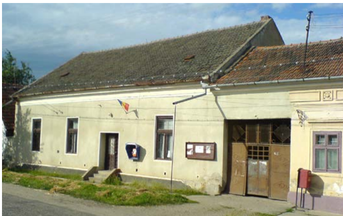
Primăria comunei Miniș

Primăria și-a desfășurat activitatea într-o construcție veche aflată în proprietatea comunității satești, în centrul localității, unde-și avea sediul și notarul. Înainte și după 1918 funcția de primar era onorifică, primarii fiind aleși din rândul celor mai gospodari țărani din sat. Datorită faptului că Minișul a avut dintotdeauna o populație majoritar românească, locuitorii au avut oportunitatea de a-și alege conducătorii (primari și consilieri) și de a-și organiza o viață națională proprie, mai intensă decât în alte localități ale podgoriei. Primarii epocii au fost în exclusivitate români, ei reprezentând unul sau altul din partidele aflate la putere, fără a cunoaște doctrina sau statutul acestora. Documentele vremii și