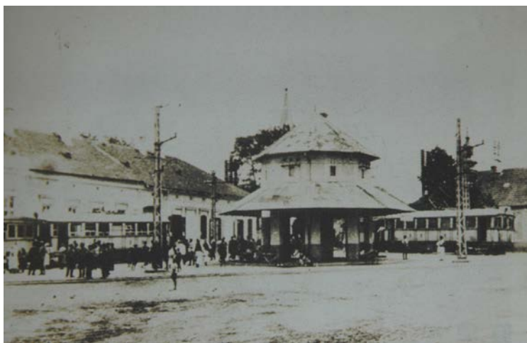
Tramvaiul electric – poză de epocă

Intrarea în funcțiune din anul 1906 a liniei ferate înguste cu un tren cu combustie internă pe traseul Arad-Ghioroc-Pâncota și Radna a însemnat un mare eveniment care a depășit cu mult granițele județului. Lungimea totală a traseului era de 58 km, dintre care cea mai mare parte străbătea centrul localităților dintre Ghioroc și Arad cât și a celor din Podgoria Aradului. Lipsa de randament îndeosebi în locurile cu pante a determinat Societatea Anonimă „Calea Ferată Arad-Podgoria” să treacă la electrificarea traseului, începând cu anul 1912 32 . La 13 aprilie 1913 a fost inaugurată calea electrificată pe linie îngustă, prima de acest fel din spațiul românesc și prima din sud-estul Europei 33 . Tracțiunea era asigurată de către 15 automotoare electrice fabricate de către firma Ganz Co. Danubius din Budapesta, care serveau în același timp și ca vagoane de clasa I-a. Alături de acestea mai circulau pe traseu 22 de vagoane de călători de clasa a II-a cât și 28 de vagoane de marfă de diferite tipuri, toate pe patru osii. Vagoanele de clasa a II-a cât și cele de marfă acoperite și descoperite au fost produse la