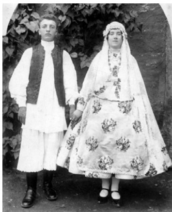
Costume de nuntă – „Ița și Pupu”

Costumele tinerilor căsătoriți au fascinat dintotdeauna prin distincția, curățenia și bogăția lor, probând o dată în plus geniul creator al meșterilor populari.