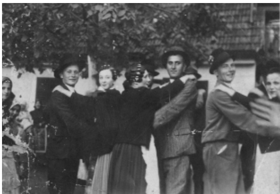
La joc - 1939