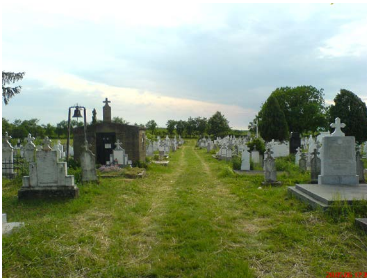
Cimitirul satului – aleea principală

În extravilanul localității din zona pământurilor arabile, dinainte și de după calea ferată, circulau următoarele toponime: „la Nemți”,