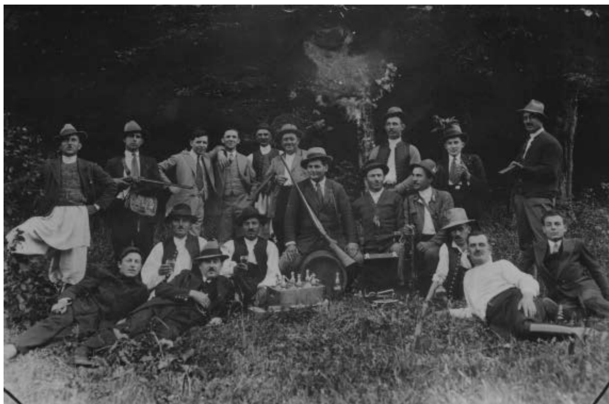
Vânătorii din Miniș

Așezarea Minișului într-o zonă de deal și colinară cu păduri bogate a favorizat dezvoltarea fondului cinegetic care era una din sursele de venituri pentru comună. Periodic, de