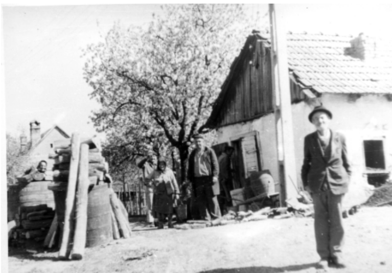
Cazanul de țuică – „Joiana”