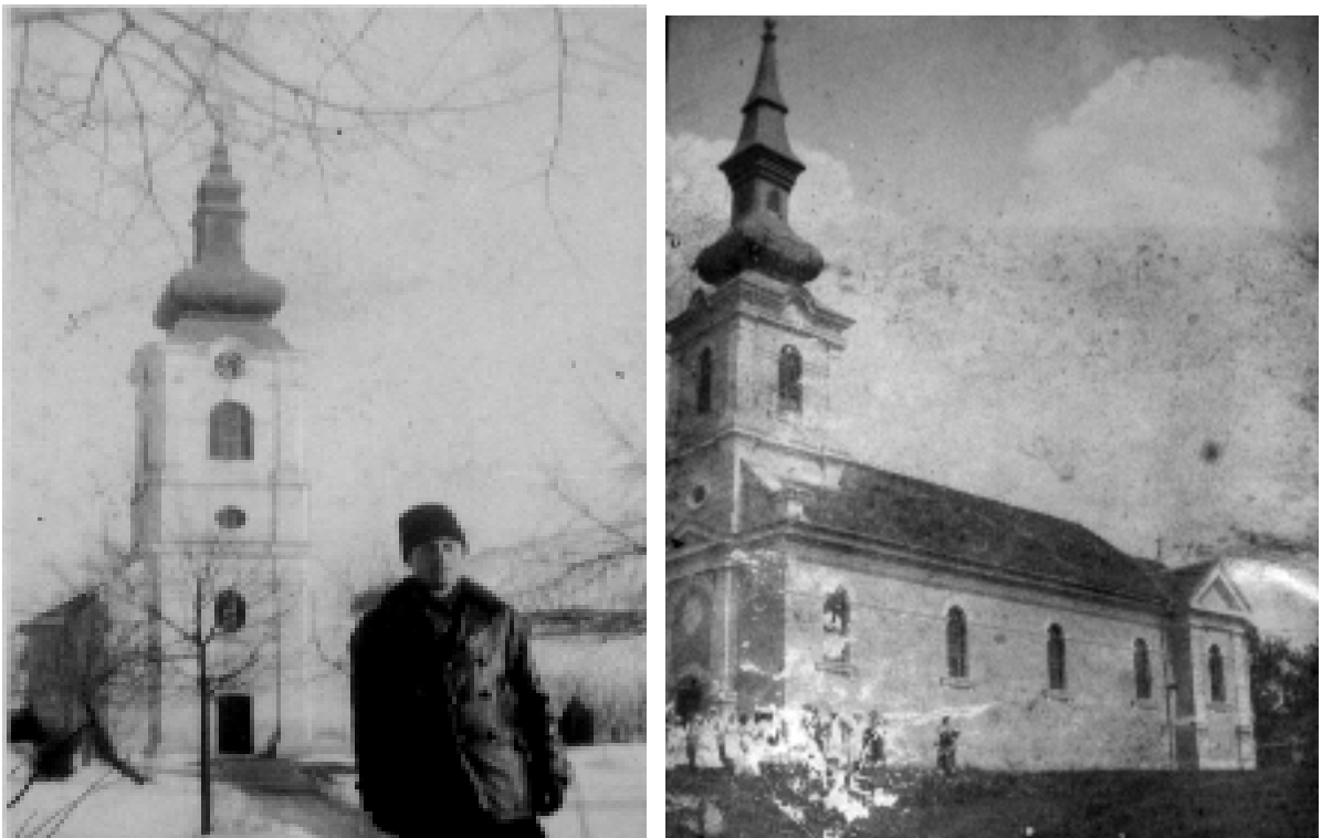
Clădirea vechii biserici din Miniș

Parohia satului Miniș a fost menționată în documente încă din secolul al XIV-lea ca aparținând ritului greco-oriental. Astăzi știm cu certitudine că bisericile localității au fost construite din vechime pe una din cele două văi principale ale satului, care poartă acest toponim-martor de sute de ani 76 . În anul 1729 a fost sfințită biserica din lemn a satului Miniș ce purta hramul „Sfinții 40 de mucenici”. Cu siguranță ea a fost ridicată în locul sau chiar pe locul alteia mai vechi, care este posibil să nu mai fi corespuns atât din punctul de vedere al mărimii cât și al stării materiale. Noua biserică nu a rezistat nici ea mai mult de trei decenii, ruinându-se la rândul ei. Pentru a se evita repetarea unei astfel de situații, locuitorii satului au hotărât să ridice o biserică nouă din piatră și cărămidă. Ridicarea noii biserici implica asigurarea a cel puțin două condiții majore: fonduri consistente și eliberarea autorizației de construcție de către autoritățile austriece și Mitropolia Ortodoxă de la Carloviț.