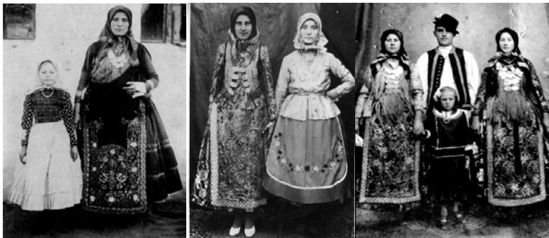
Costume populare de sărbătoare

Ținuta de sărbătoare a femeii din primăvară și până în toamnă era mult mai bogată și mai diversă, după starea materială a fiecărei familii. Pe cap se purta cotul de mătase cu pană de pliș, cot din cârțiță cu fir pe margine, cot de mătase cu fir auriu sau cotul peșcănesc. La gât se purta salba de galbeni sau de taleri și măргеle. În partea superioară a corpului se îmbrăca o cămeșe de Toledo sau bluză din pânză de casă țesută cu broderie sau cipcă, peste care se lua zobonul cu fir auriu și cu copcii din argint. La mijloc femeia se încingea cu latul cu islogi, cu fir cu opt măsuțe, cu latul guverit sau cu o cătrânță. În partea de jos a corpului se foloseau poalele din bumbac alb țesute în casă, peste care erau luate după caz, rochie de mătase, rochie cu holuri sau rochie guverită. Pe picioare se purtau ciorapi albi până la genunchi, legați cu ștroplande (jartiere) iar ca încălțăminte se foloseau sandalele cu baretă sau șlarfii din catifea cu volănașe. Ținuta de sărbătoare din timpul rece se compunea din: cot de pliș gros pe cap, cot de