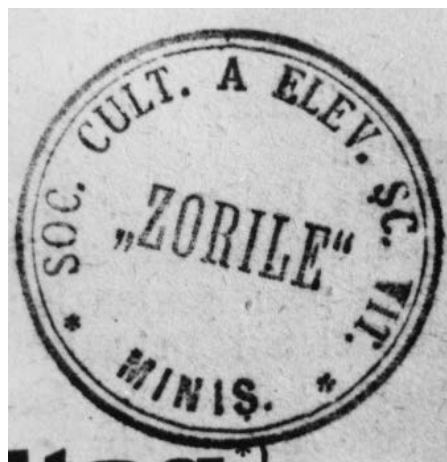
Ștampila Societății „Zorile”

Activitățile extrașcolare aveau în marea lor majoritate o componentă cultural-artistică, un rol însemnat în această direcție avându-l Societatea de lectură a elevilor „Zorile” înființată în februarie 1928. Societatea avea organizare proprie, cu un președinte, secretar, bibliotecar și doi cenzori. Ea dispunea de o bibliotecă cu 400 de volume și de un aparat de radio care