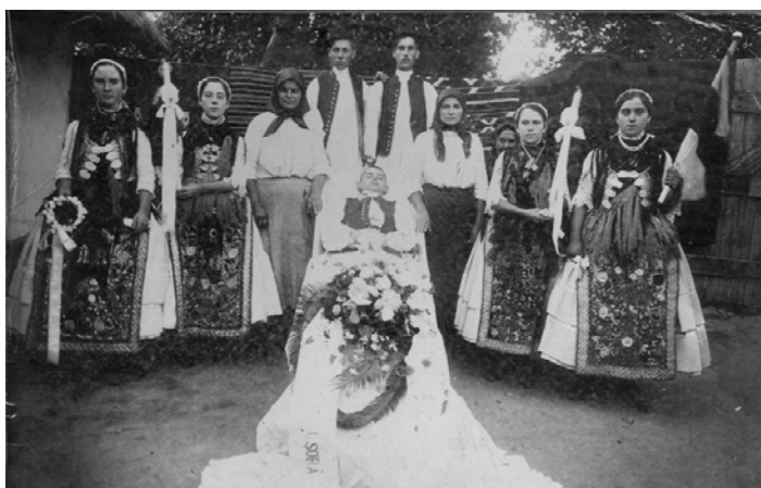
Înmormântarea unui tânăr - 1918

Clopotele bisericii vesteau dispariția membrului comunității indicând prin tonalitate dacă