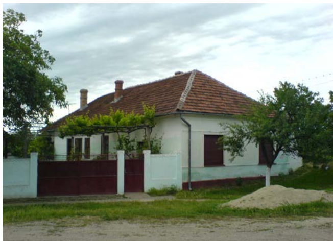
Casa parohială, localul școlii