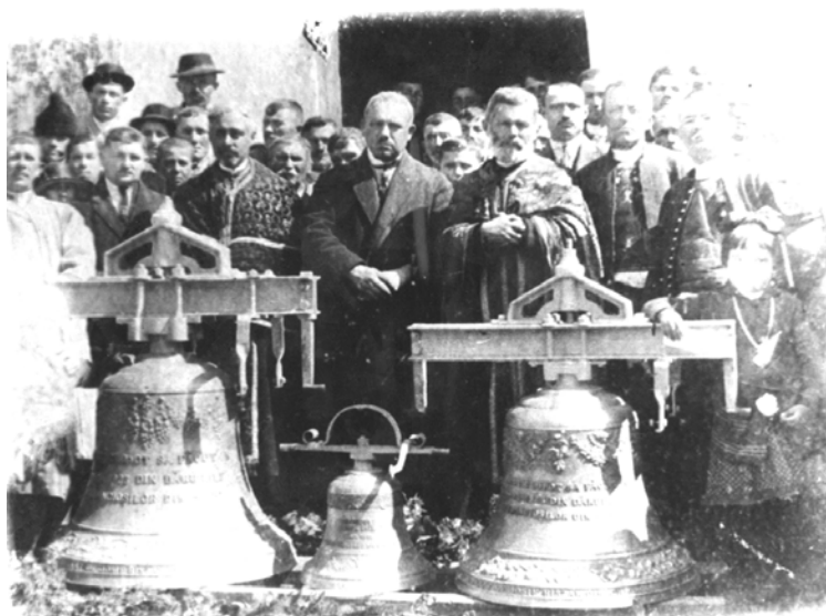
Clopotele vechii biserici - 1923

Viața bisericească a satului Miniș s-a derulat pe alte coordonate după realizarea Marii Uniri de la 1 Decembrie 1918. Centrul de greutate al activității bisericești s-a deplasat din domeniul național-școlar spre perfecționarea pastorației, administrației și asistenței sociale. La inițiativa sinodului parohial local, în anul 1923 au fost cumpărate trei clopote noi în locul celor vechi, care au fost rechiziționate de către autorități în timpul primului război mondial. Cele trei