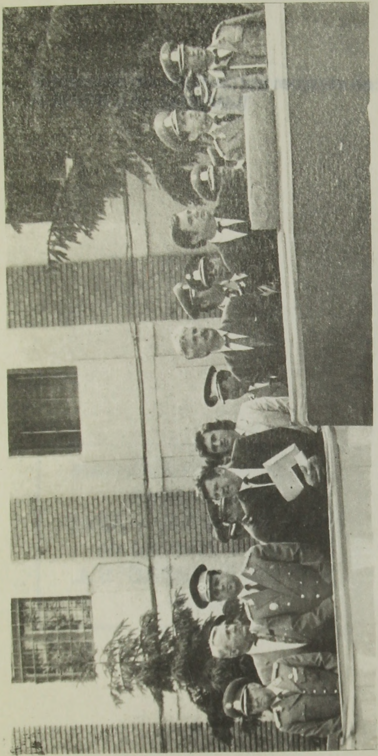
Senatorul Ioan Alexandru într-o unitate militară la depunerea jurământului de credință Patriei Române de către un nou contingent de tineri ostași.