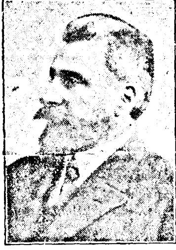
Dr. Vintilă I. C. Brătianu

La numita zi se întrunește adeca, la București, congresul general al partidului. Nu într'atăta pentru a-și da seama, în chipul obișnuit, de activitatea unui an, ci mai mult pentru a-și revizui scopurile politice-patriotice de urmări pe viitor, în folosul public, și cu deosebire pentru a-și fixa mijloacele și metodele de acțiune din viitor.