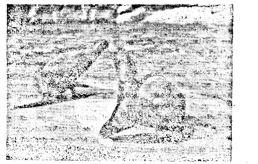
Focile din Grădina Zoologică din Berlin, cu tot frglul fac dragoste