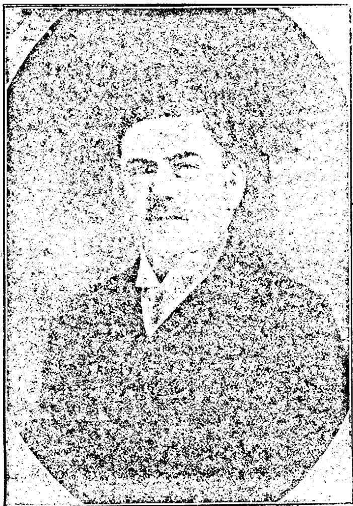
Martirul dr. Ioan Ciordaș