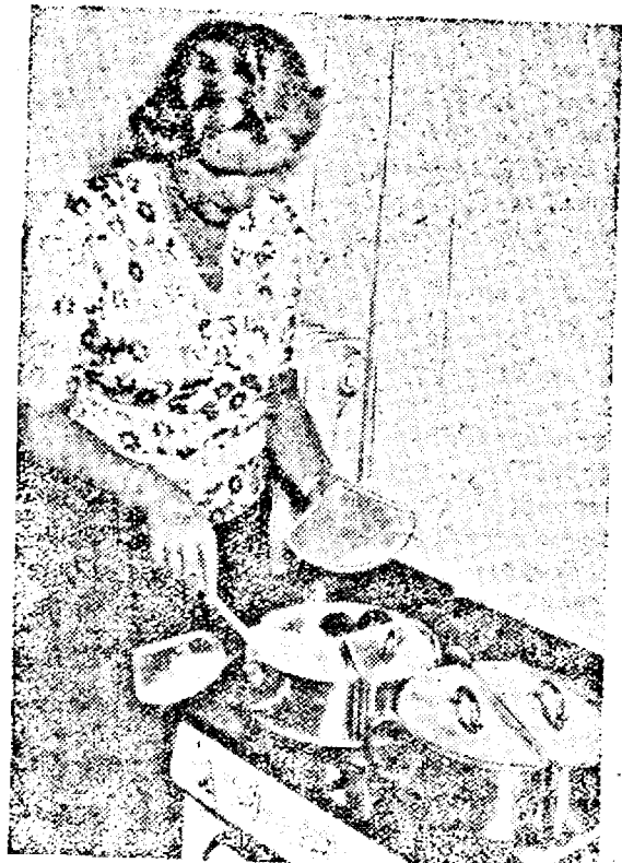
ȘI CRACIUNUL ANULUI ACESTA OFERĂ MULTE NOUȚĂȚI FRAC-TICE DE MENAJ

O inscenare formidabilă Fantastic — uluitor — senzații — aventuri cu RAY CORRIGAN