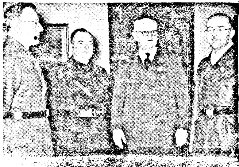
SS. Himmler, șeful poliției secrete germane și Mussert, conducătorul mișcării naționaliste olandeze, cu prilejul unei vizite a acestuia la Berlin.

Avorul „Non stop” va fi mai din amele cele mai periculoase ale armatei germane.