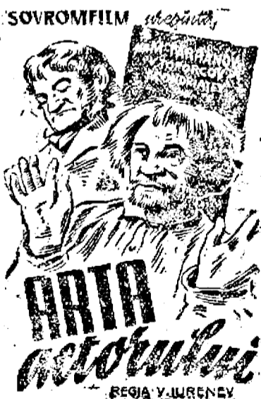
REGIA V. IURENCO

prezintă numai Mierc. 17- Joi 18- Vineri 19 August