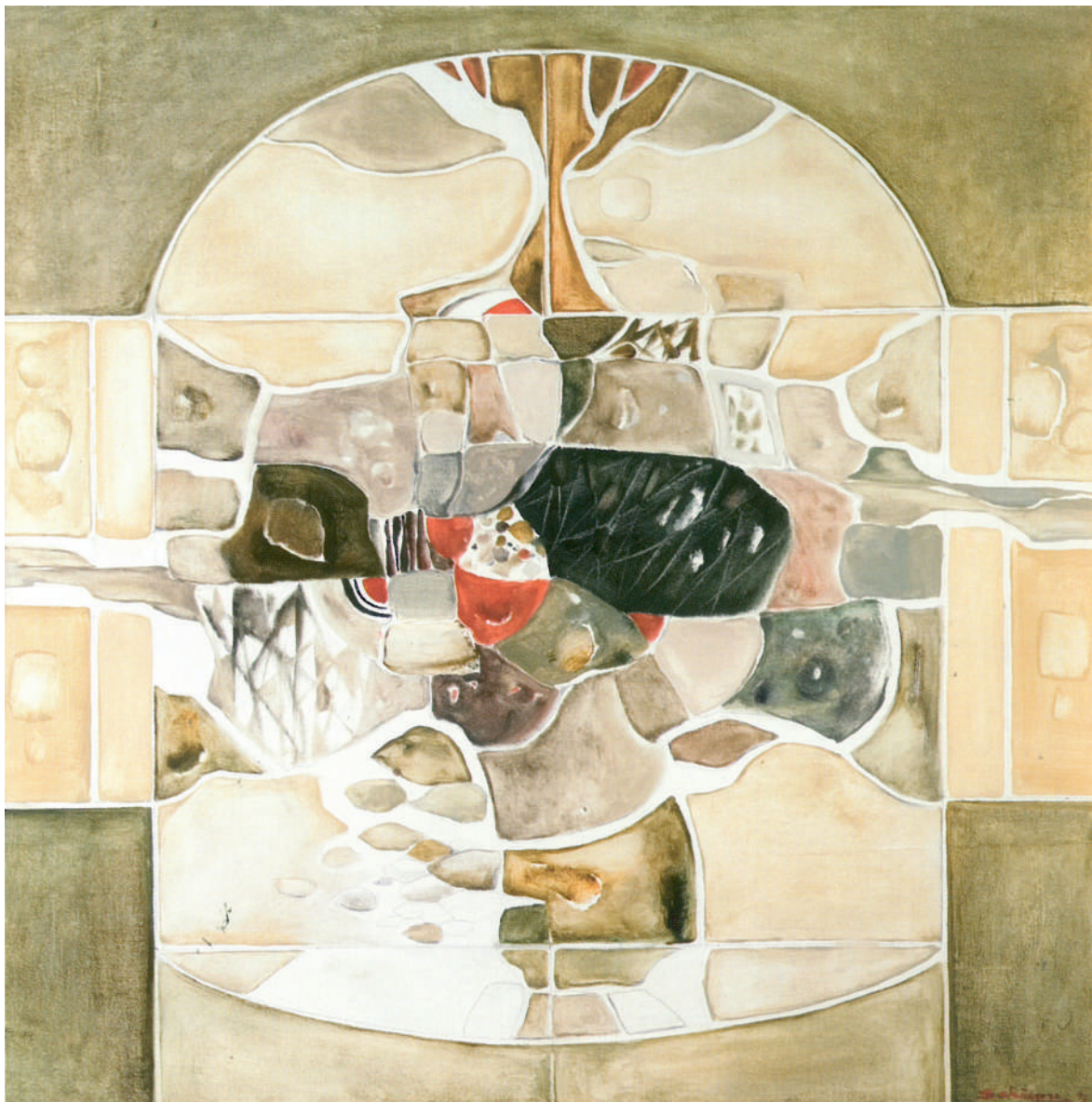
Andrei Șchiopu - Însemnele Pământului