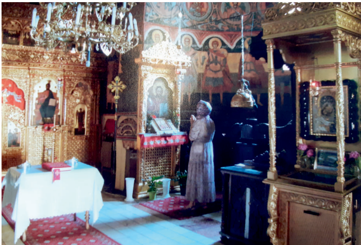
În rugăciune - în fața Altarului Mănăstirii Hodoș-Bodrog