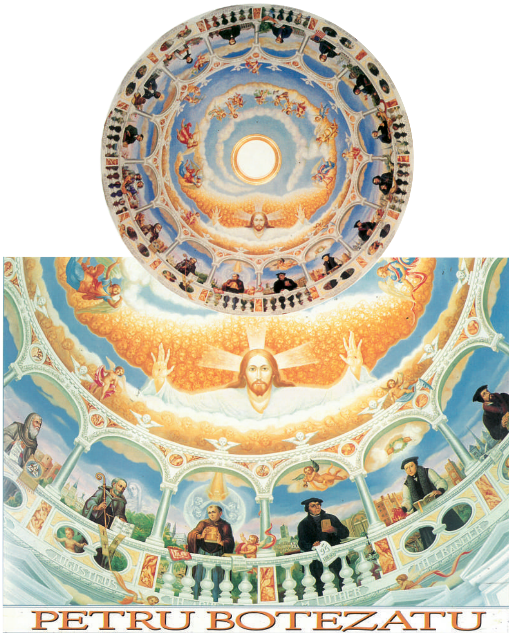
Domul Capaelei Beeson de la Universitatea Samford