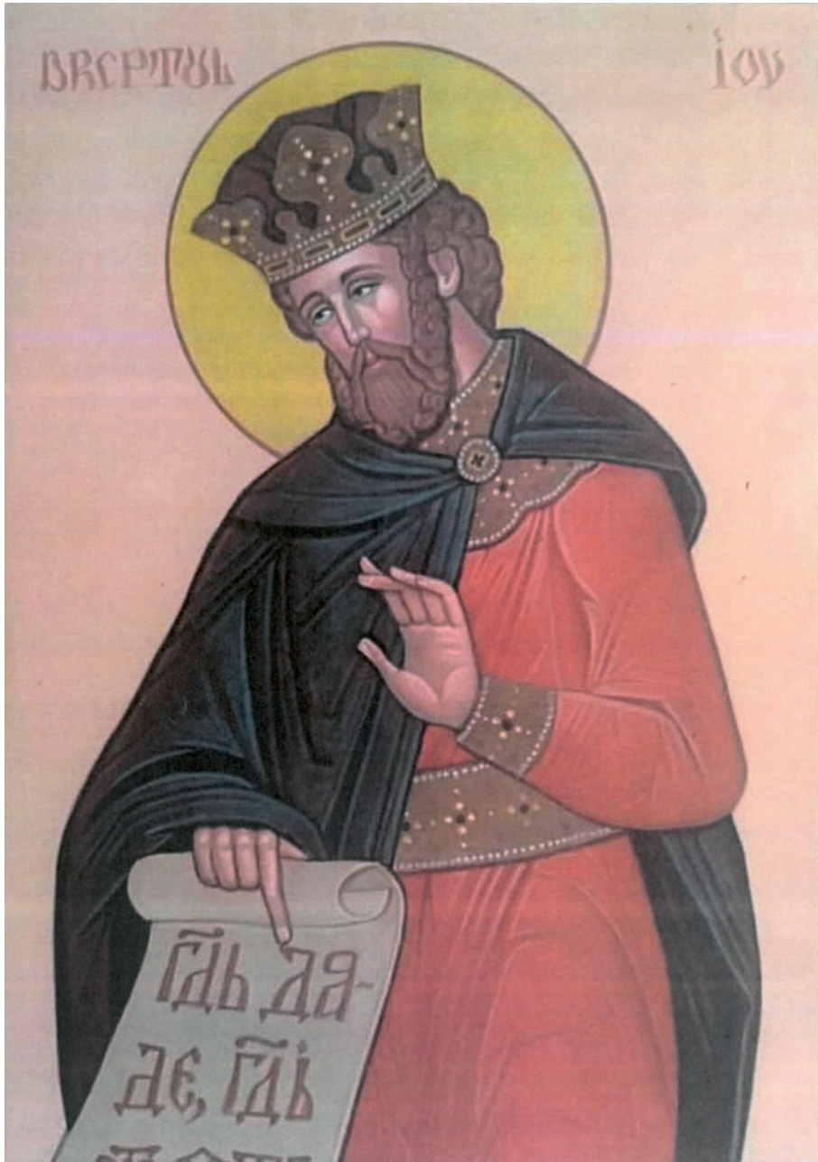
Dreptul Iov - Aurel Dico - pictor icoane și artă monumentală