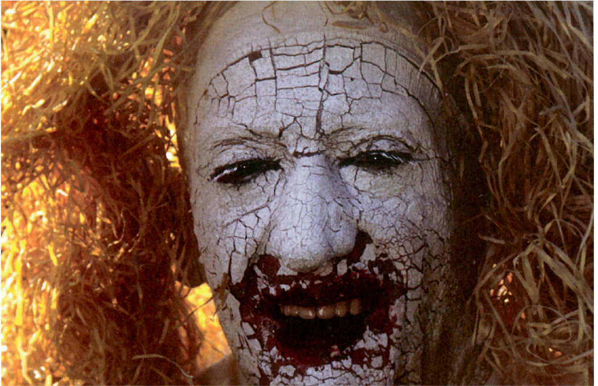
Omul cu o mie de chipuri