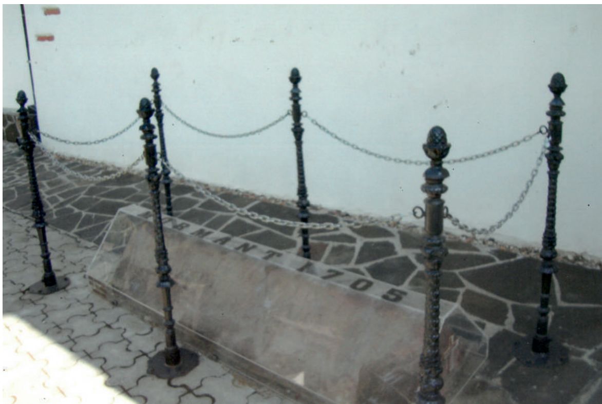
Mormântul călugărului ce n-a fost primit de Pământ Mănăstirea Hodoș Bodrog