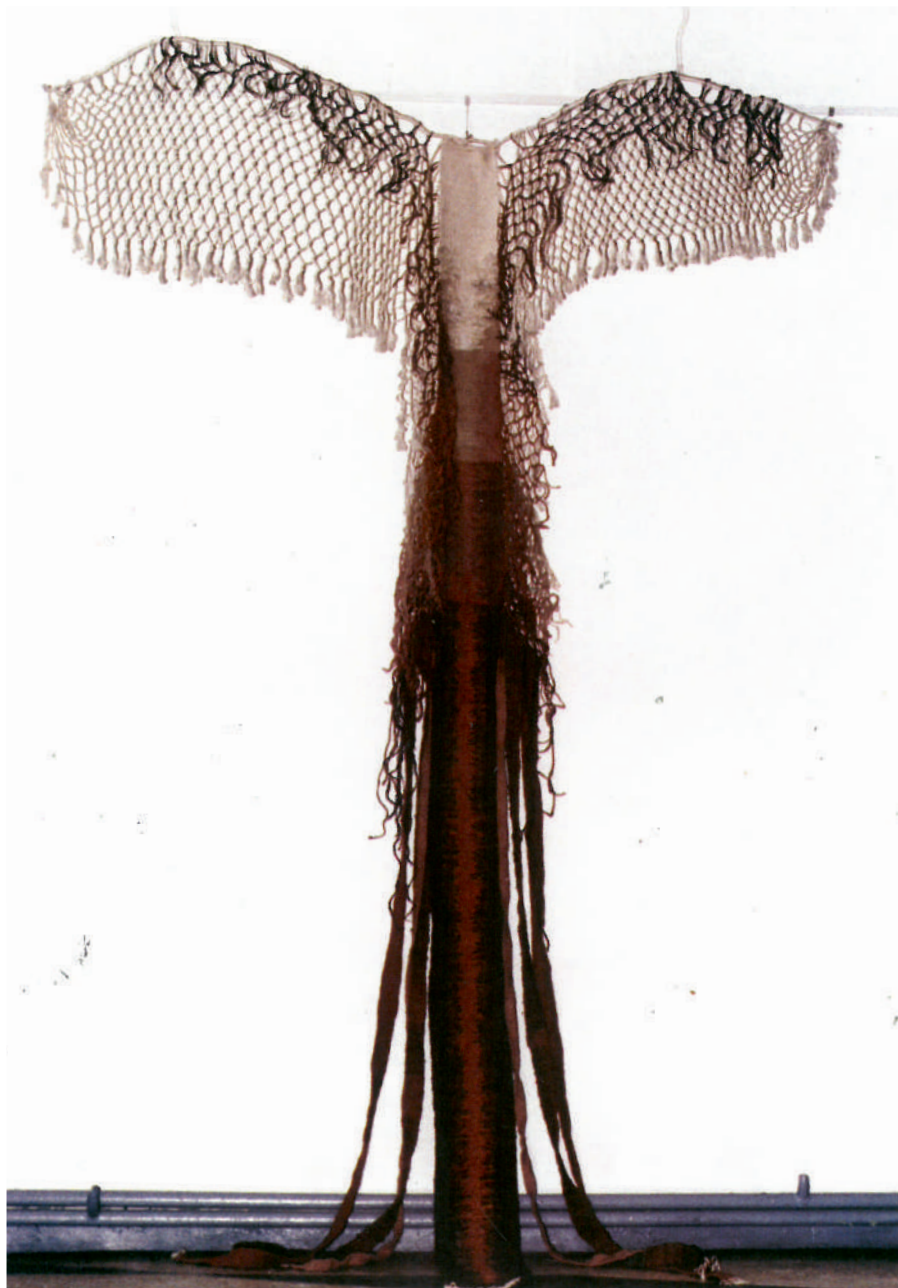
Elena Stoinescu - Înălțare - tapiserie