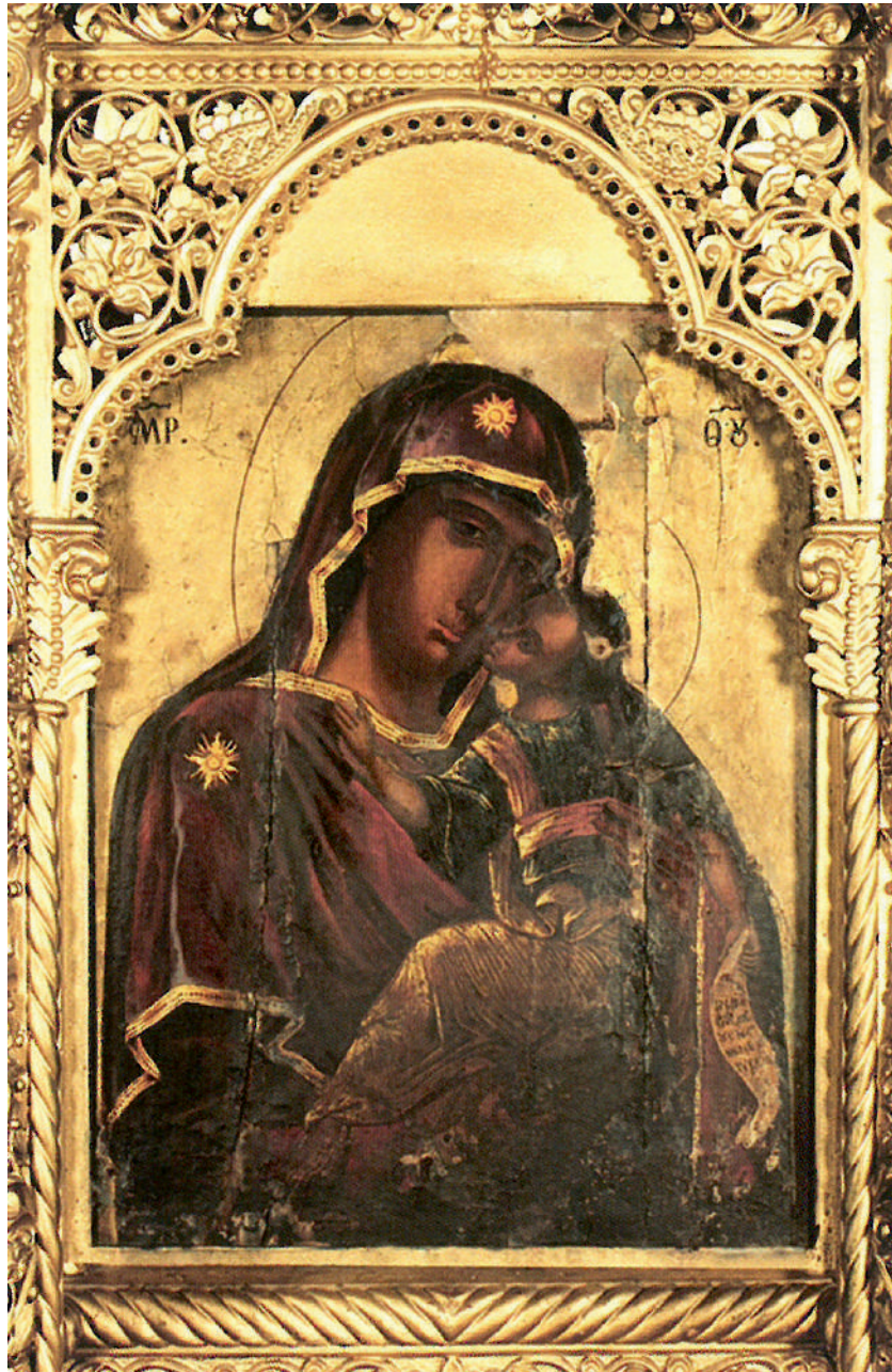
Icoana Maicii Domnului cu Pruncul Iisus - Făcătoare de Minuni Mănăstirea Hodoș-Bodrog