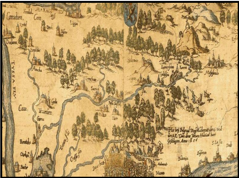
Fig. 2. Detaliu din NOVA TOTIUS UNGARIAE... de Matthias Zündt, 1567