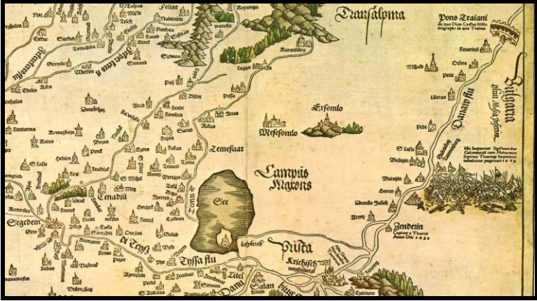
Fig. 1. Detaliu din Tabula Hungariae de Lazarus, 1528