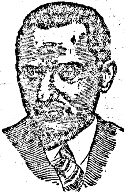
D. MIHAIL ANTONESCU

Trecând la examinarea unora din consecințele bombardamentelor, și, mai ales, la situația evacuaților veniți pe pământurile Banatului, Domnia Sa a rugat pe domnii generali comandanți și pe domnii prefeți, să propună Guvernului,