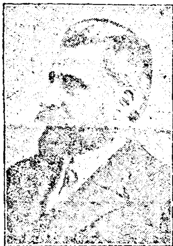
V. BRĂTIANU președintele Partidului Național-Liberal. Marile reforme politice

România Mare nu putea refuza, mai ales, provinciilor care rupeau lanțurile robiei istorice, așezămintele democratice și votul obștesc care le erau făgăduite și care se realizau chiar de statele stăpânitoare de ieri: ea nu putea rămâne, în mijlocul popoarelor, o insulă izolată conservând, singură, privilegiile politice și așezămintele anacronice.