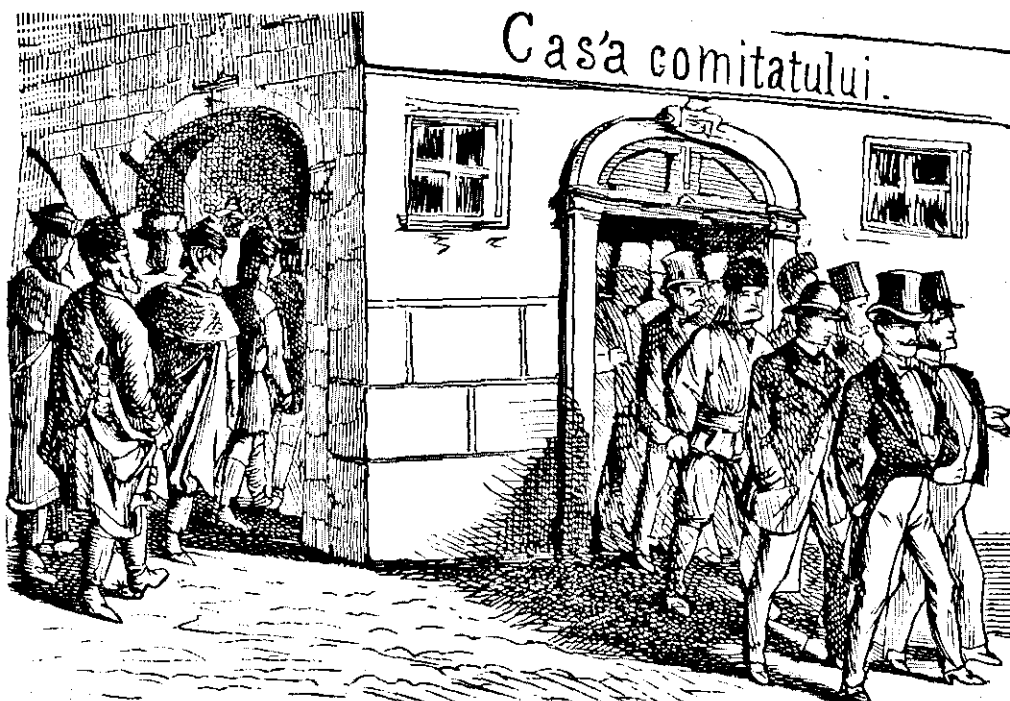
O scena dupa organizarea comitatelor conformu noului proiectu de lege.

Proprietariu, redactoru respundiatoriu si editoru: Iosifu Vulcanu.