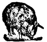
După foto înță