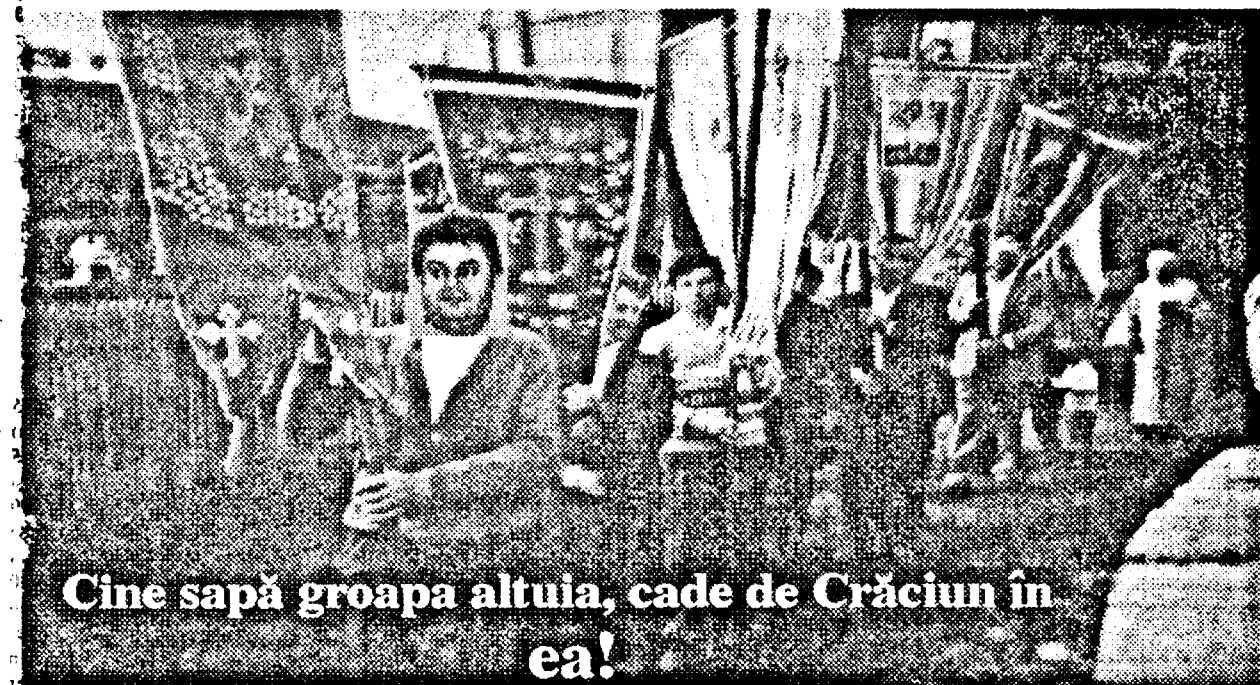
Cine sapă groapa altuia, cade de Crăciun în ea!