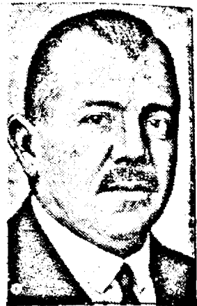
Vicecancelarul SCHUMY, care în calitate de min. de interne poartă greutatea răspunderii pentru viitoarele evenimente.

Pentru a preveni eventual a tempera spiritele, oficial se anunță, că în consiliul de miniștri de Vineri, 20 Sept., cancelarul Streeruwitz a obținut aprobarea de a propune în ședința de Joi, 26 Sept., a Consiliului Național amendarea Constituției în ce privește prerogativa președintelui republicii, depolitizarea administrației, reorganizarea poliției. În același timp se va supune Consiliului Național și o lege specială pentru combaterea mișcărilor teroriste.