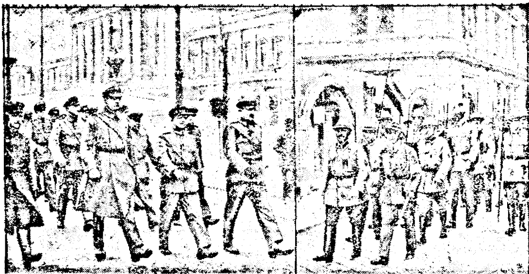
La dreapta, manifestația Heimwehr-ului austriac, la stânga manifestația Schutzbund-ului socialiștilor — democrați pe străzile Vienei.

Suferinzi de anemie, paliditate, lipsă de apetit, debilitate și dureri de cap, să folosească numai lichidul ferminos nutritiv Ferrol al dr. Földes, care promovează producerea moleculelor roșii de sânge, provoacă un apetit excelent în urmare e cel mai bun mijloc de îngrășare. Bolnavul și suferindul