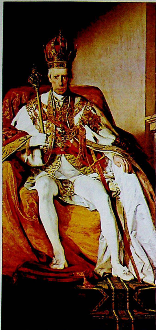
Fig.2. / Abb.2.