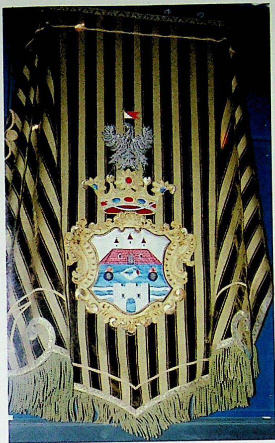
Fig.10. / Abb.10.