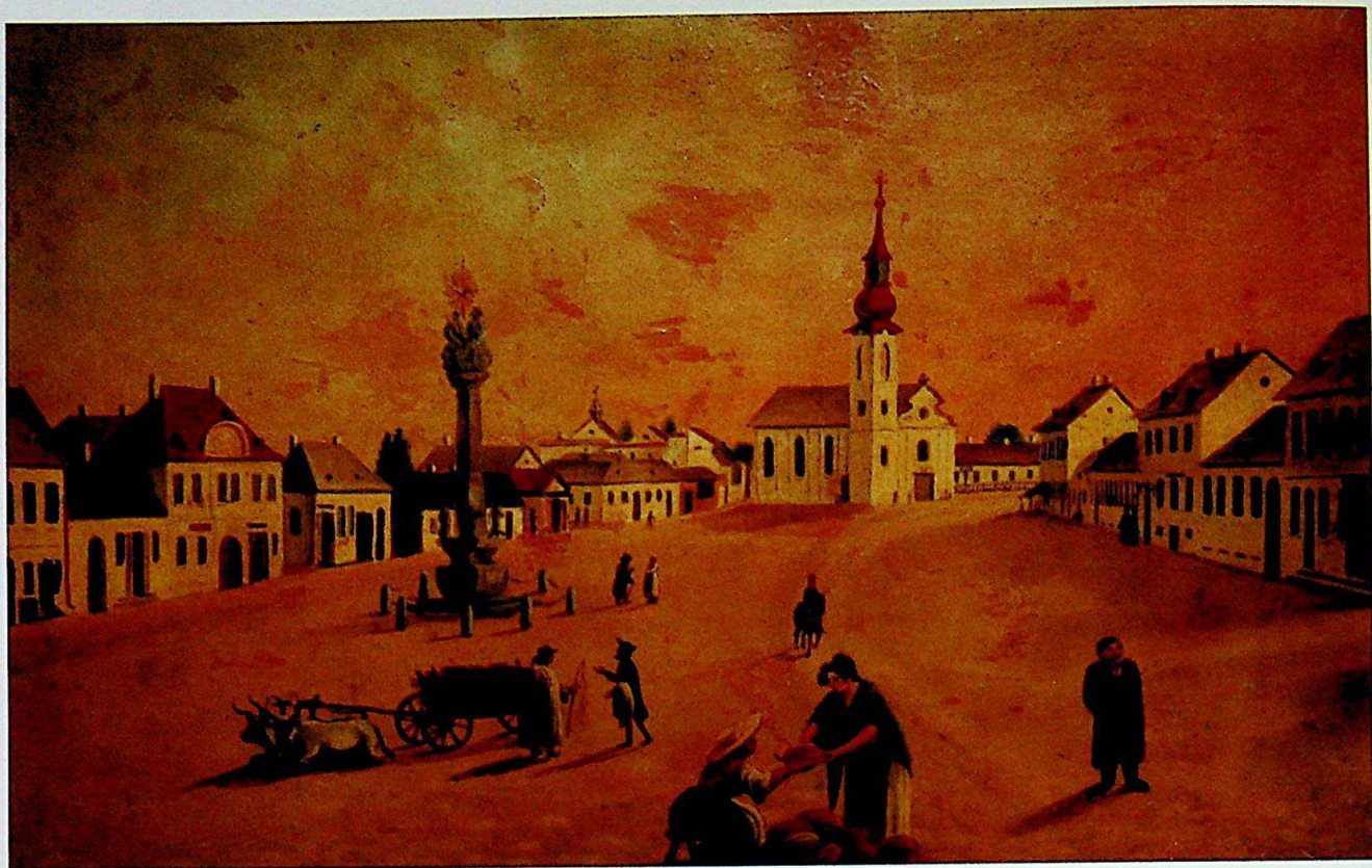
Fig.12. / Abb.12.