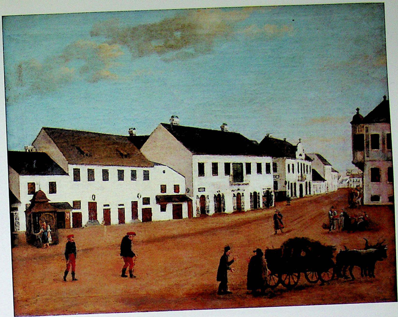
Fig.6. / Abb.6.