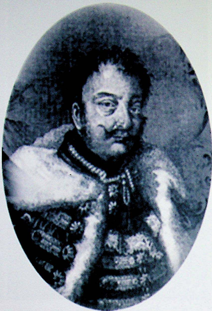
Fig.3. / Abb.3.