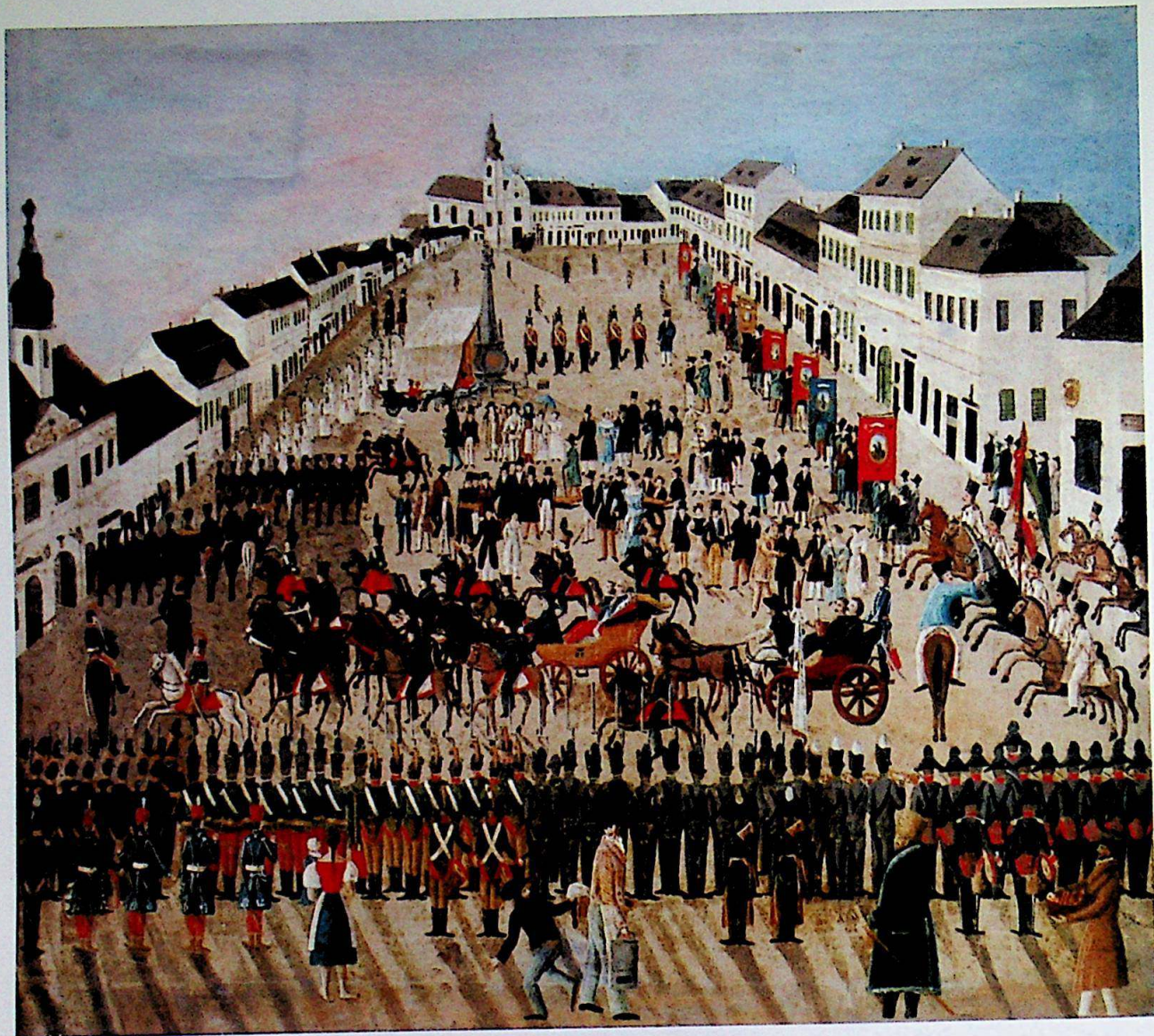
Fig.1. / Abb.1.