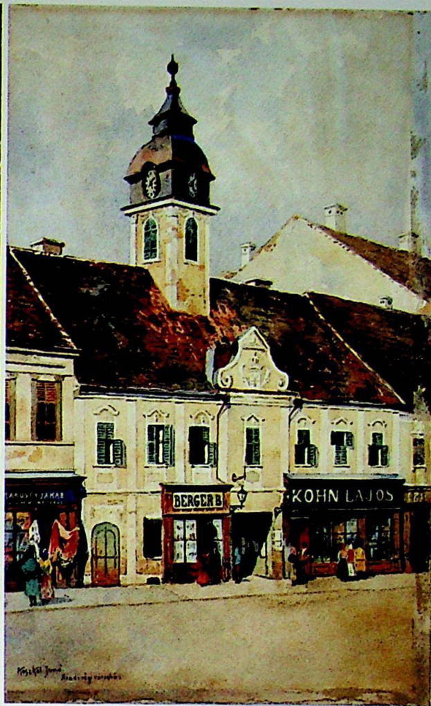
Fig.4. / Abb.4. 44