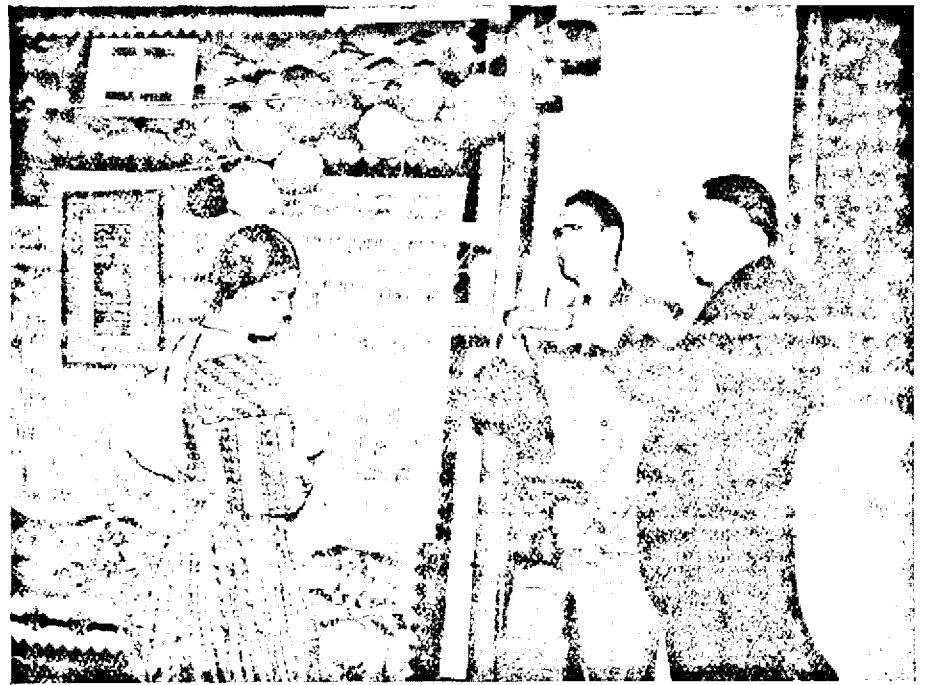
Locșitorul fuhrerului dl. Hess interesându se de arta țesătoriei românești

să viziteze expoziția spune că, d. Virgil Molin, printr'o muncă permanentă și neobosită, a reușit într'un timp scurt, să înfățișeze produsele noastre admirabil, creiând astfel acel „Colț sub soare„ al nostru atât de necesar pentru a ne impune atenției tuturor.