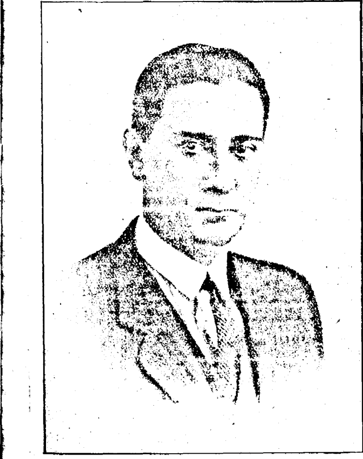
D. Mihail Ralea, ministrul Muncii