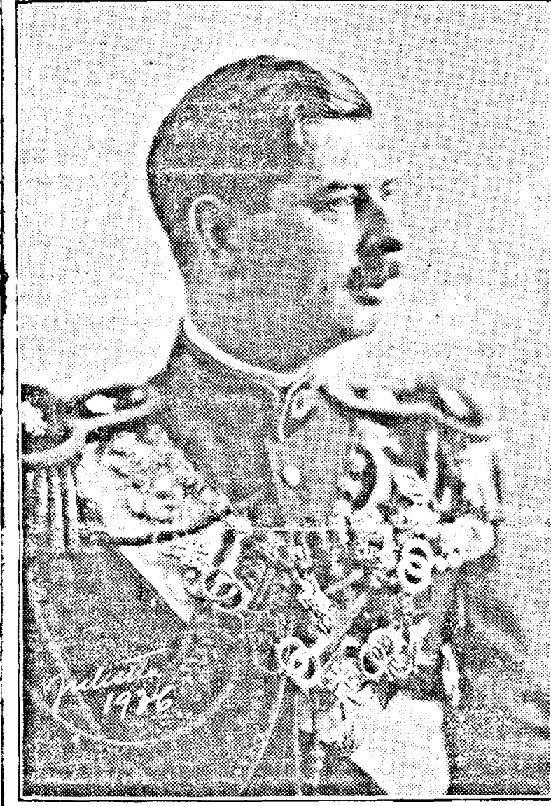
M. S. Regele Carol al II-lea

„Fiecare cetățean este o rotiță din mecanismul Statului pentruca întregul organism să fie deplin de folos, trebuie ca fiecare, la locul unde l'a așezat soarta să-și facă pe deplin datoria, mânat de un singur gând și călăuzit de un singur suflet, acel al Neamului Său”.