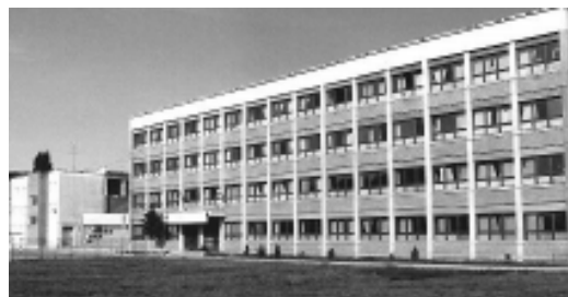
Școala generală nr. 22 „Caius Iacob”

Fondul de carte al bibliotecii școlare a fost îmbogățit, în anul 1934-1935, cu noi volume. În anul 1942, dispunea 300 de volume, în 1950 de 423, iar în 1985-1986, Școala nr. 12 deținea 12. 580 volume. Regăsim, în bibliotecă, în anul 2010, cca 15. 000 de volume 277 .