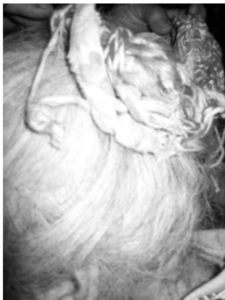
Conci cu ceapță

În zile de sărbătoare fetele de măritat îmbrăcau haine albe de mătăasă, „înforfoiate” cu mai multe jupoane.