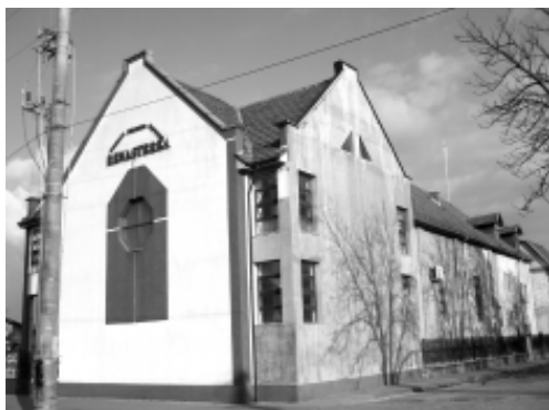
Biserica Creștină Baptistă „Renașterea” din Micălața. 2010

Din anul 1919, comunitatea a hotărât să cumpere un teren, pe care să fie construit edificiul bisericesc. Proiectul s-a materializat în 1921, iar ridicarea clădirii a fost finalizată abia în 1926. Odată cu augmentarea numărului bapțiștilor, ei au format primul cor în anul 1911, prima orchestră în anul 1947 și prima fanfară în anul următor. Pastorii, care au slujit de-a lungul timpului, au fost: Ioan