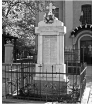
Monumentul eroilor din fața bisericii

Numele celor morți sunt scrise cu litere de aur: