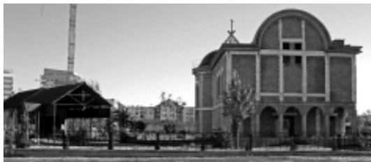
Biserica Ortodoxă Română „Sf. Apostol Andrei”