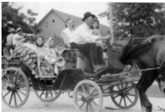
Pelerinaj cu căruțele la Mănăstirea Hodoș-Bodrog

În popor sărbătoarea este cunoscută ca „ Sfântă Mărie Mare ”. Micălăcenii mai de vază și cei mai credincioși mergeau, în trecut, în pelerinaj la mănăstirea Hodoș Bodrog, cu căruțe cu „șireglă” sau cu căruță cu „arnieu”. Copiii erau așezați pe fânul din șireglă. Porneau spre mănăstire în 14 august, după amiază, pe la ora 15, cântând „ Cruce sfântă părăsită ” sau „ Noi plecăm la mănăstire, Mărie/Dumnezeu cu noi să fie, Mărie ”, etc. Acolo ajungeau spre seara.