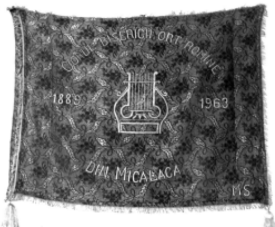
Steagul corului Bisericii Ortodoxe Române Micălaca Veche

În anul 1929 a fost confecționat pentru cor un steag din mătase, pe care a fost scris cu fir de aur „ Corul bisericii ort. rom. din Micălaca. 1889-1929 ”.