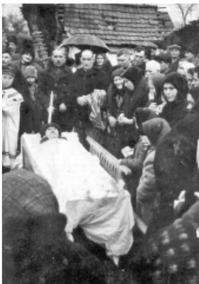
Scaunul cu care era dus mortul la groapă