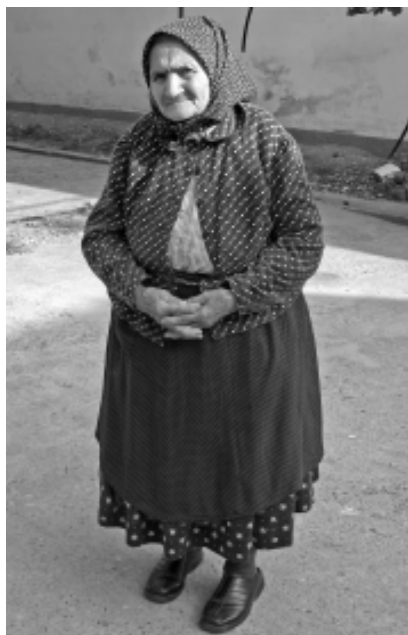
Port bătrânesc de lucru

În picioare, femeile erau încălțate cu pantofi negri de catifea.