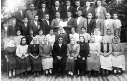
Corul Bisericii Creștine Pentecostale Micălaca. 1954

cu o soră mai mare. Corul și-a desfășurat activitate și în anul 1954.