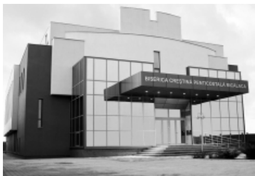
Biserica Creștină Penticostală Micălaca. 2010

de-a lungul timpului, numeroase solicitări autorităților arădene pentru a construi pe terenul de pe Calea Radnei, nr. 248 A, un nou edificiu bisericesc. Demersul s-a materializat, în 22 aprilie 2003, când Primăria Municipiului Arad a concesionat terenul menționat, de 1817 m 2 , de pe Calea Radnei, cu intrare de pe strada Renașterii nr. 2 B.