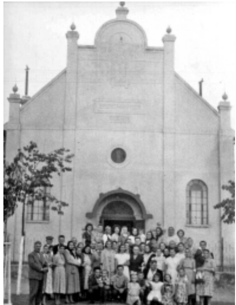
Biserica Creștină Baptistă „Renașterea” din Micălaca. 1960