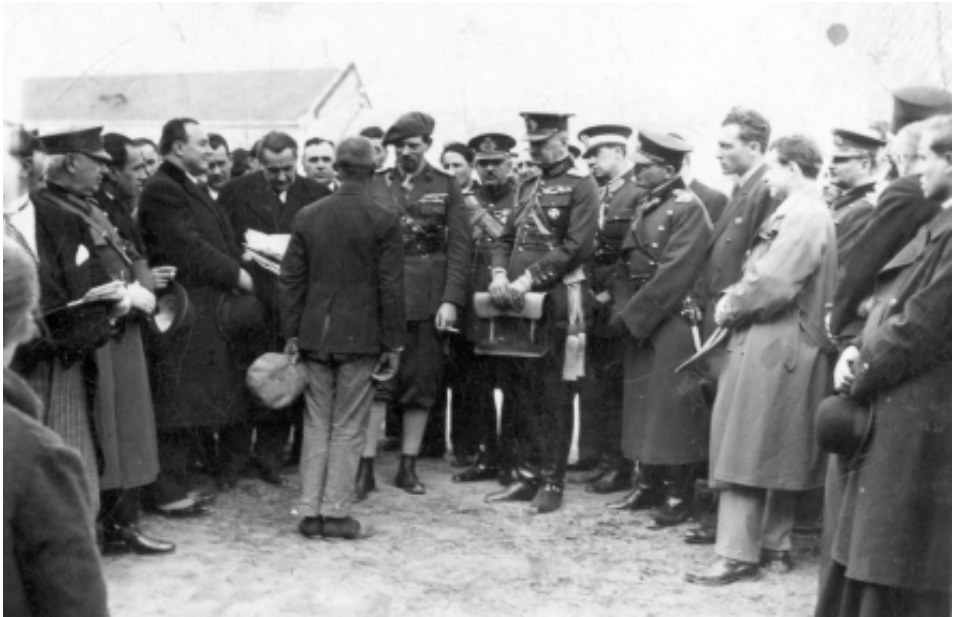
Regele Carol al II-lea, vorbind cu micălăcenii

adresă din 1932 a Primăriei Arad către Prefectură, s-a menționat că: „Domnule Prefect, la adresa Dvs. No. 11618/932 din 20 ianuarie 1934, cu regret trebuie să Vă comunic, că nu putem achita suma de 25. 000 de lei, restanță cu care datorează suburbia Micălaca fondului de construcții școlare, din următoarele motive. Din restanțele ce Primăria avea să le încaseze de la locuitorii din Micălaca, după anexarea acesteia la orașul Arad, fostul angajat al Primăriei însărcinat cu încasările a delapidat o sumă considerabilă, la care Primăria a trebuit să renunțe. În urma inundației din anul 1932, Primăria a renunțat la încasarea restanțelor din Micălaca, ba chiar a acordat ajutoare sinistraților și a contribuit la refacerea acestui cartier. Primăria a refăcut școlile din Micălaca Veche și Micălaca Nouă, precum și locuința directorului, toate fiind distruse de inundație, a prevăzut cu materialul didactic necesar aceste școli și a înființat o grădiniță de copii în Micălaca Nouă. Vă rugăm să binevoiți a renunța la suma de 25. 000 de lei luând în considerare faptul că Primăria a cheltuit cu școlile din Micălaca înzecit suma cerută de Dvs. Arad, 1 februarie 1934”.