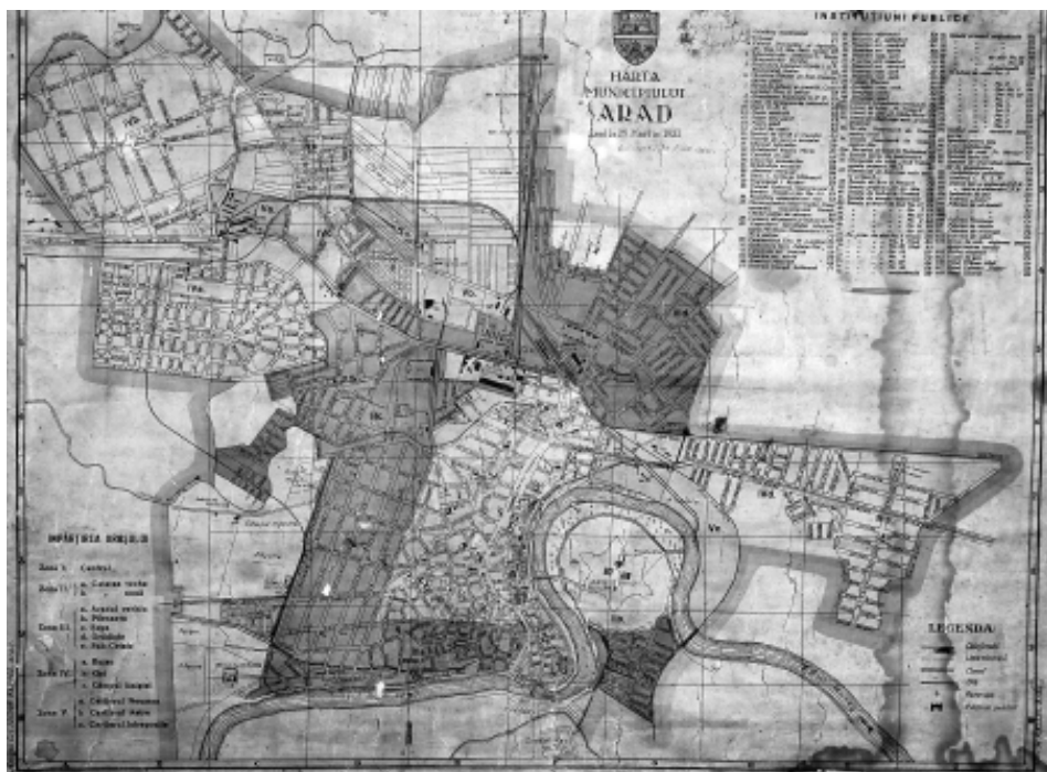
Harta Aradului din 1931

apă. Deoarece tocmai în acel timp pe Mureș trecea un șir de plute cu lemne, 18 vaci cu lapte, mai mulți viței și 6 boi au nimerit sub plute și s-au înecat. Sătenii vorbesc și astăzi că s-a înecat jumătate din ciurda de vaci, iar faptul că cealaltă jumătate a scăpat se datorează ciurdarului care, în mod iscusit, a sărit în apă și a ținut de coarne taurul comunal, care era și inițiatorul iureșului. Paguba materială suferită de gospodarii din Micălaca a fost una considerabilă.