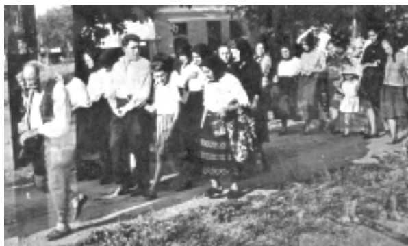
Cortegiul funerar în drum spre cimitir

servea decât rachiu, bărbaților. Aceștia jucau cărți în timp ce femeile povesteau. Cele din familie obișnuiau „să se cânte” după mort. Acum la priveghi se servesc prăjituri, suc.