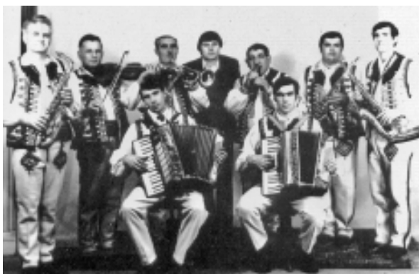
Taraful din Sâmbăteni