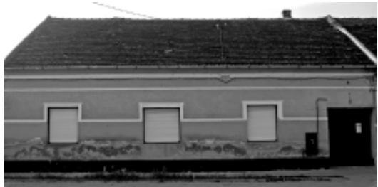
Biserica Creștină Pentecostală Micălaca până în 2008

Comunitatea pentecostală, în anul 1946, a fost nevoită să-și schimbe locația. A funcționat, pentru o scurtă perioadă, într-o casă mai spațioasă, pe strada Renașterii, nr. 29. Autoritățile arădene au solicitat cedarea localului pentru a deschide un magazin alimentar, oferind, în schimb, casa din str. Renașterii, nr. 2A. Amenajarea spațiului s-a finalizat în anul 1948. Aici, s-au desfășurat serviciile religioase până în anul 2008, sub conducerea pastorelui Cornel Borlovan. Conducerea a înaintat,