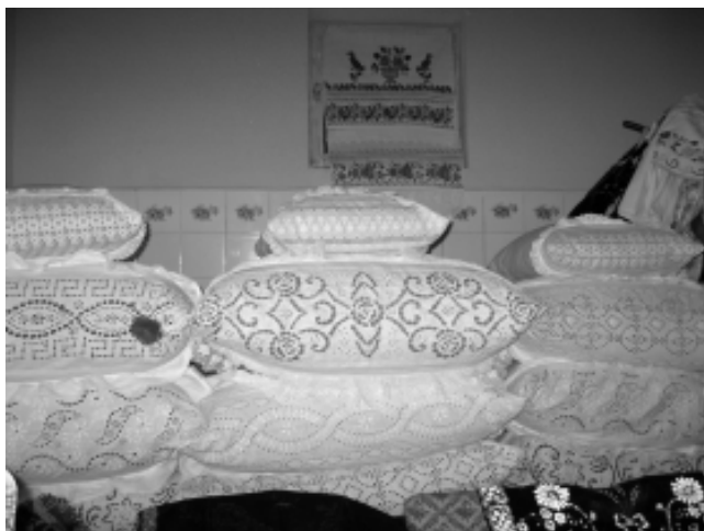
Pat cu perne

Interiorul tradițional, care, în multe case, s-a păstrat până după al doilea război mondial, a fost unul fix, același la toate familiile. Camera curată, de oaspeți, în care nu se locuia, era obligatoriu frumos împodobită, aranjarea ei fiind o ocazie de etalare a bogăției și a priceperii femeilor din casă. Aici se găseau două paturi, fiecare pe câte un perete, de o parte și de alta a ferestrelor. Paturile erau clădite (aveau strujac, două dune, perne) să fie cât mai