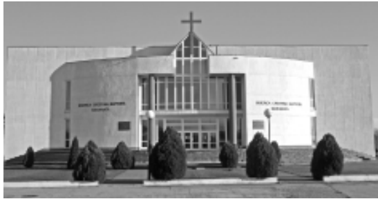
Biserica Baptistă Maranata. 2010