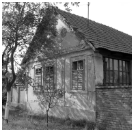
Casă bătrânescă cu șolocaturi la ferestri și coridor pe jumătate închis

De-a lungul întregii case se întinde un gang,