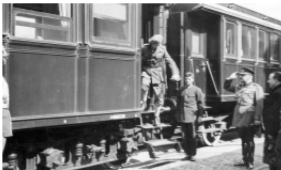
Regele Carol al II-lea. Sosirea la Arad

văzând dezastrul, la plecare i-a dăruit suma de 1. 000 de lei. În acea zi, Regele Carol al II-lea le-a dăruit sinistraților micălăceni, în total, suma de 300. 000 de lei.