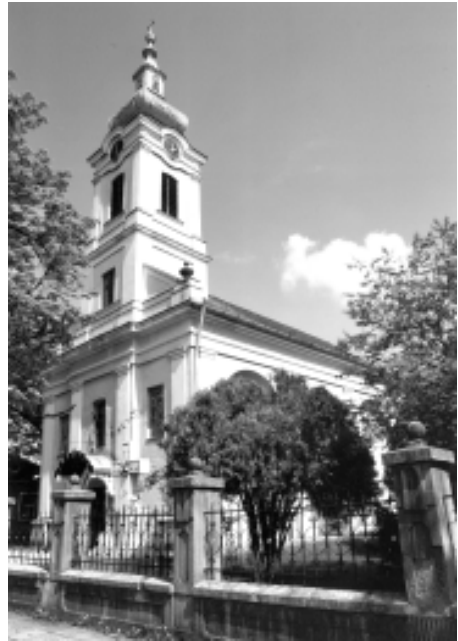
Biserica Ortodoxă Română Micălaca Veche, cu hramul „Sf. Mare Mucenic Gheorghe”

În zidul fațadei dinspre apus se află două ferestre oarbe, în care au fost prinse, cu scoabe, două icoane pe tablă, reprezentându-l pe Sf. Mare Mucenic Gheorghe, patronul bisericii, și pe Sf. Mare Arhanghel Mihail 292 .