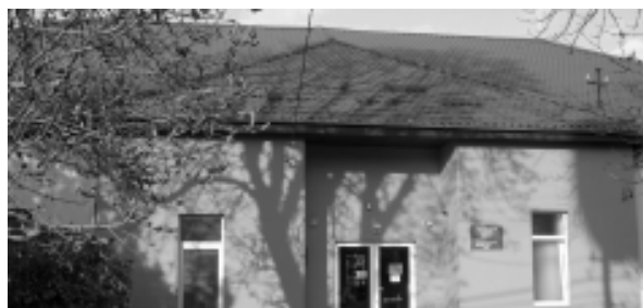
Grădinița cu P. N. nr. 7