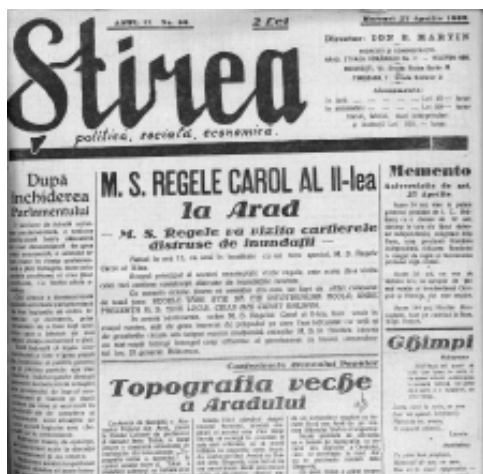
Ziarul „Știrea” anunță sosirea regelui