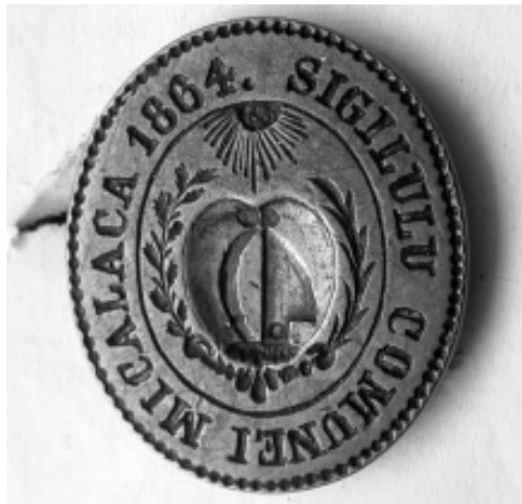
Sigiliul comunei Micălaca din 1864

În cea de-a doua jumătate a secolului al XIX-lea, comunitatea românească din Micălaca avea să se manifeste – asemenea tuturor localităților românești din satele transilvănene, dar cu precădere în cele din comitatul Aradului, unde românii erau populația majoritară – din punct de vedere