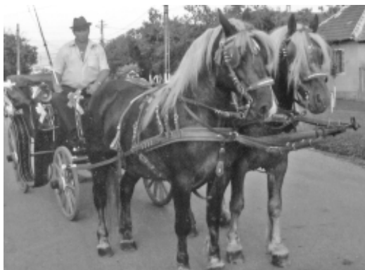
Birje împodobită pentru nuntă (2010)

În duminica nunții, junele mergea cu muzica după nănași și îi aducea la casa lui, unde le dădea să mănânce papricaș sau „ sarme ”, apoi plecau după