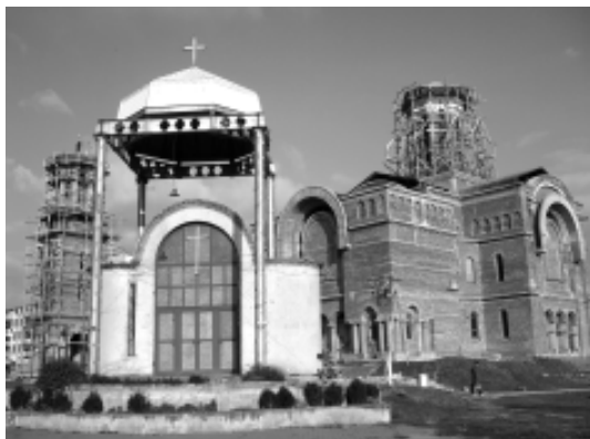
Biserica Parohiei Arad Micălaca Veche II