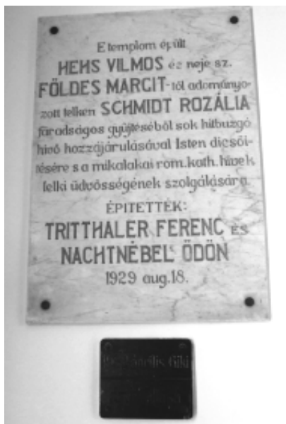
Biserica Romano-Catolică „Adormirea Maicii Domnului”. Placa de marmură de la intrare