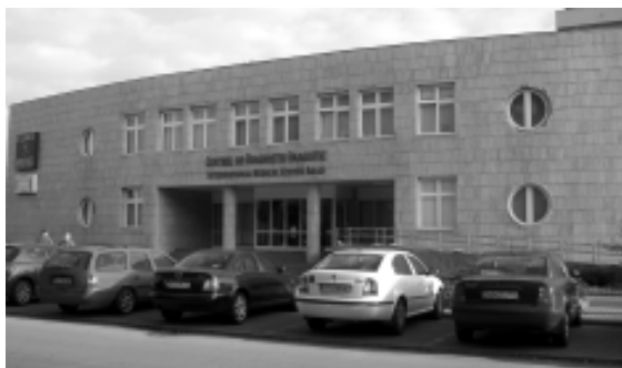
Centru de Diagnostic și Imagistică medicală Euromedic Arad Romania

În ultimul deceniu al secolului XX și în primul