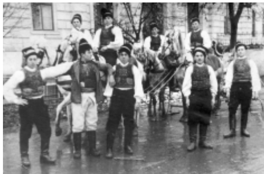
Feciori din Micălaca umblând cu Plugușorul prin Arad