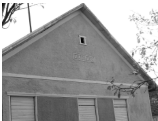
Fronton cu inițialele proprietarului

cald). În capătul opus străzii, gangul a rămas deschis și din el se intra în tindă, cămară, grajd.