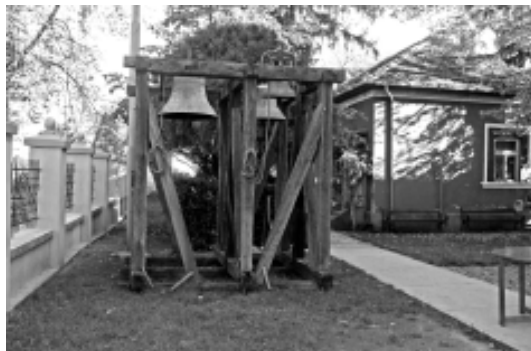
Clopoțele din curtea Bisericii Ortodoxe Române Micălaca Veche