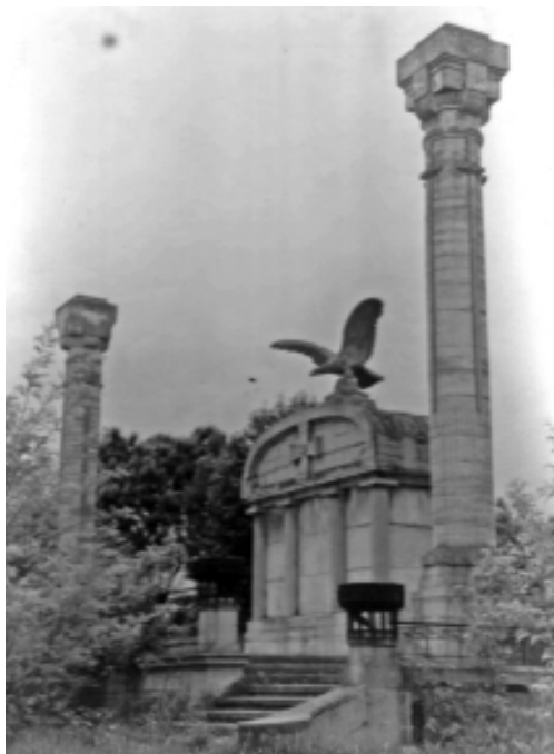
Monumentul eroilor căzuți în Primul Război Mondial, în fostul cimitir militar din Arad-Micălaca

În perioada dualismului austro-ungar, micălăcenii și-au păstrat, nealterat, caracterul românesc al așezării, folosind limba română în antistia comunală și în redactarea actelor bisericești. Nu dispunem de date despre participarea nominală a unor locuitori din Micălaca la Alba Iulia, în 1 Decembrie 1918, dar putem presupune că o delegație din Micălaca a fost alături de puternica delegație a Aradului la acest mare eveniment național. O referință cu puternice reverberații naționale o găsim în anul 1914, la izbucnirea Primului Război Mondial, când românii din Micălaca, care au fost mobilizați, au solicitat să defileze pe centrul Aradului în grup compact, românesc, cântând cântece naționale, din care n-a lipsit „Deșteaptă-te române”. Deoarece problemele legate de Armată și de Apărare se găseau în directa subordine a Vienei și nu țineau nicidecum de voința Budapestei, cererea ostașilor micălăceni a fost acceptată. În plus, detașamentul românesc din Micălaca și-a confecționat și un drapel propriu de luptă, numai că micălăcenii, jucându-se puțin cu culorile steagului imperial, le-au nuanțat în așa măsură, încât acestea erau roșu, galben și albastru, de fapt culorile naționale românești.