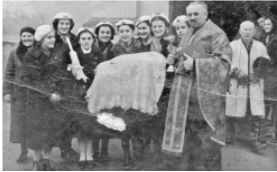
Botez la biserica din Micălaca Veche (1954)

Mai demult, mortatilitatea în comunitățile tradiționale fiind foarte ridicată, copiii slăbuți sau bolnavi erau botezați la o săptămână sau mai repede, însă potrivit datinii, în condiții normale se boteza la 6 săptămâni. De obicei nașa de căsătorie era aceea care boteza copilul. În trecut nu se făceau mese mari de botez ca azi.