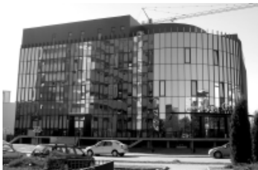
Spitalul clinic, SC Genesys Medical SRL