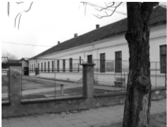
Școala primară nr. 15