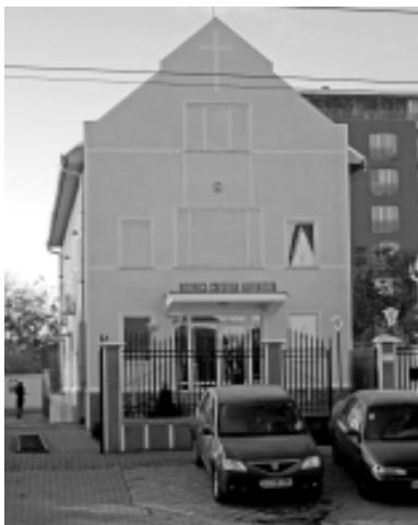
Biserica Creștină Adventistă de Ziua a Șaptea Micălaca Arad

La 4 noiembrie 1997, a fost cumpărat terenul de pe strada Voinicilor nr. 29. Lucrările au început în 12 mai 1998. Proiectul clădirii a fost executat de firma S. C. Proiect S. A. Arad prin arhitecții Gh. Seculici, Elisabeta Cosma și Monica Cuznețov. Primul serviciu religios a avut loc în anul 2000, însă abia în 31 mai 2003, a fost inaugurată biserica.