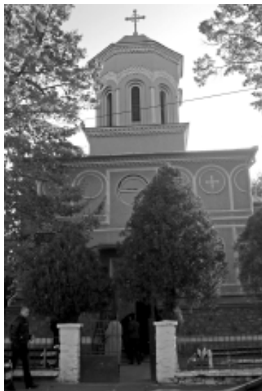
Biserica Ortodoxă Română Micălaca Nouă, cu hramul „Sfinții Arhangheli Mihail și Gavril”

Construcția bisericii din Micălaca Nouă, cu hramul „Sfinții Arhangheli Mihail și Gavril” și a casei parohiale a început în anul 1930, în vremea