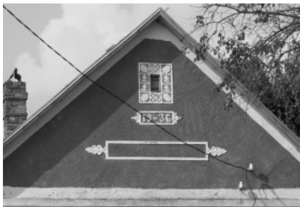
Ornamente din tencuială la fronton