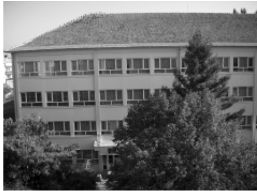
Școala generală nr. 12