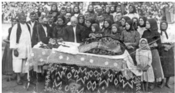
Scoaterea mortului în curte

Priveghiul ținea în trecut o seară și nu se