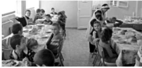
Cantina "colii generale nr. 22 „Caius Iacob”