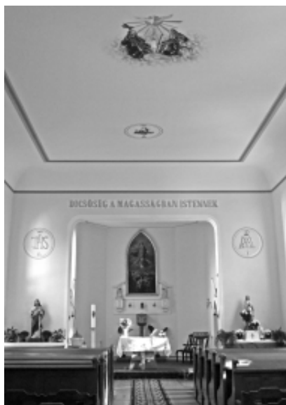
Biserica Romano-Catolică „Adormirea Maicii Domnului”. Interior