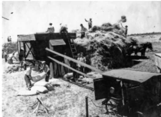
Treieratul la G. A. C. „Mureșul”(1959)

Odată cu colectivizarea și înființarea Gospodăriei Agricole Colective „Mureșul”, proprietarii de altădată au fost nevoiți să lucreze la stat.