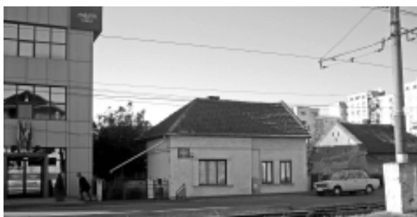
Grădinița P. N. nr. 18 Arad