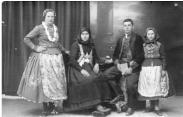
Port de fată de măritat, de femeie măritată, de fecior și de fată din Micălaca (1942)