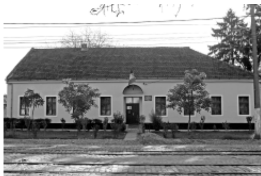
Grădinița cu P. N. nr. 11 Arad

Pe lângă cele două școli ale cartierului – Școala generală nr. 12 și Școala Generală nr. 22 „Caius Iacob” își desfășoară activitatea din secolul al XX-lea câteva instituții de învățământ preșcolar: Grădinița cu P. N. nr. 11 Arad, Grădinița P. P. nr. 18 „Căsuța Piticilor” Arad, Grădinița P. N. nr. 18 Arad, are două clădiri: una pe strada Fabius,