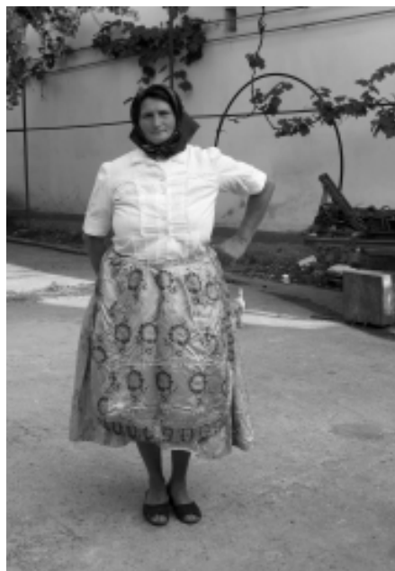
Port de femeie măritată azi