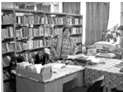
Biblioteca Școlii generale nr. 22 „Caius Iacob”