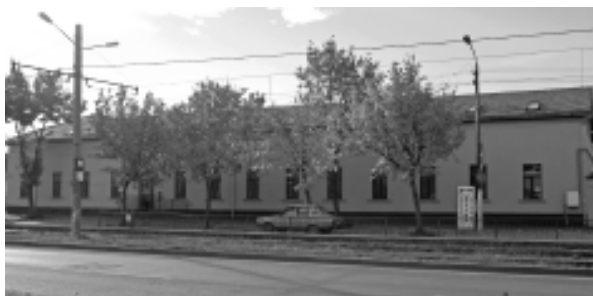
Grădinița P. P. nr. 18 „Căsuța Piticilor” Arad