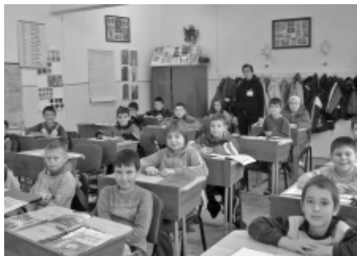
Sala de clasă Școala generală nr. 12

Edificiul școlar a fost reabilitat. A fost construită o sală de sport modernă, sălile de clasă au fost dotate cu mobilier modern; mai funcționează laboratoare de biologie, fizică, chimie și un cabinet de informatică, conectat, în permanență, la internet 276 .