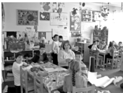
Clasă de step by step a Școlii generale nr. 22 „Caius Iacob”

de întreținere și pentru tâmplar 278 . Pe lângă săli de clasă și laboratoare de fizică-chimie, biologie, mai existau o sală festivă, cabinete de limbă franceză, religie, informatică, săli de meditații și consultații, cabinet metodic pentru clasele I-IV, cabinet medical și de recuperare motorie, sala de sport pentru clasele I-IV, direcțiune, sala profesorală, secretariat. De asemenea, dispune de o bibliotecă a cărei patrimoniu bibliofil s-a ridicat la circa 15.000 de volume și o librărie.