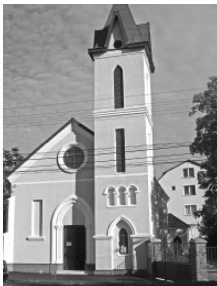
Biserica Romano-Catolică „Adormirea Maicii Domnului”

Parohia romano-catolică cu hramul „Adormirea Maicii Domnului” din Micălaca s-a înființat ca biserică prin 1900. Odată cu creșterea numărului de credincioși, în anul 1929, a fost ridicat edificiul ecleziastic, având hramul „Adormirea Maicii Domnului” 325 . În anul 1940, erau amintite Micălaca Nouă și Micălaca Veche ca filii ale parohiei Glogovăț /Vladimirescu s. n. /. Erau, în acel an, 938 credincioșii catolici, în Micalaca Nouă și 43 în Micalaca Veche 326 . Abia în anul 1967 a fost ridicată la rangul de parohie 327 .