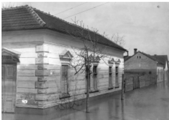
Inundațiile din 1932. Nivelul apei