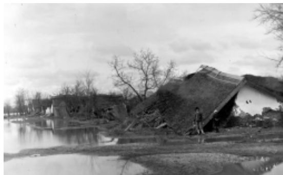
Casă distrusă de inundațiile din 1932