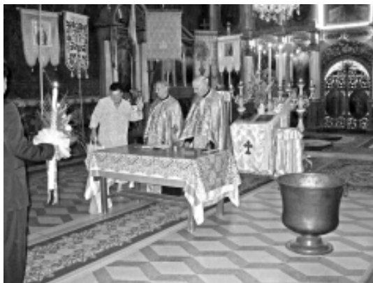
Biserica Ortodoxă Română Micălaca Veche. Interior

Iconostasul are două rânduri de câte opt coloane suprapuse, la fel ca și iconostasul de la catedrala veche din Arad, cu numeroase ornamente, reprezentând motive geometrice, florale și vegetale, care au fost acoperite cu foiță de aur.