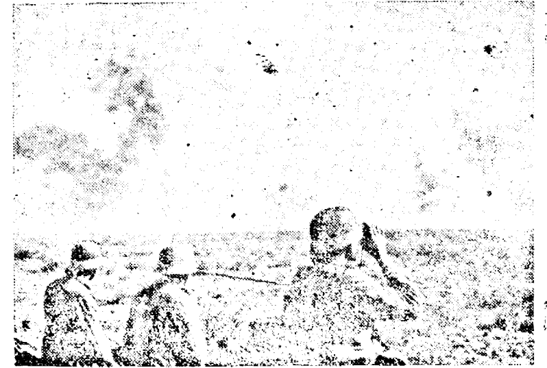
Alte german asupra pozițiilor sovietice. Avioanele Stuka atacă la orizont, unde se vede fumul produs de exploziile bombelor. (Pk. Ob.)

priu zis alte stele, vede stele de mărimea a 6-a, cine nu vede, decât o singură stea, vede stele de mărimea a 5-a. Înăuntrul acestui trapez pot fi văzute cu ochiul liber până la 8 stele. Ochii deosebit de buni au putut vedea, însă fără nici un instrument și sateliții planetei Jupiter.