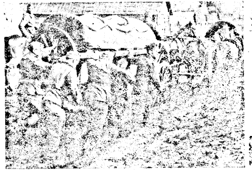
A fost de ajuns o ploaie pentru ca „șoselele” sovietice să se transforme în mocirle. Ceeace însă, după cum se vede, nu a putut opri înaintarea germană.

Ferlin, 20. — (UTA) După statistici americane, rezervele de aur britanic au înregistrat în primii doi ani de război o scădere dela 4483 milioane dolari la 1527 mil. dolari. Din acest depozit, rezervele de aur s'au și diminuat dela 2038 milioane dolari la 151 milioane dolari, creanțele în dolari pe termen scurt dela 595 la 364 milioane dolari, rezervele în efecte americane dela 950 la 227 milioane dolari și plasamente directe din USA dela 900 la 785 milioane dolari. În același moment, datorile Angliei la începerea celui de al treilea an de război, au atins 944 milioane dolari în afară de contractul împrumutului și arendărilor. Din această sumă Anglia trebuie să achite în intervalul a 6 luni 500 milioane dolari, iar restul ceva mai târziu.