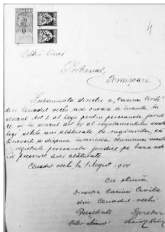
Cererea de înscriere a „Casinei Civile” în evidența de profil a Tribunalului Timișoara

„Casina Civilă 3 ” din Cenadul Vechi s-a înființat la 8 mai 1990, cu aprobarea Ministerului Afacerilor Interne din Ungaria. Aceasta avea drept scop ca „...prin conveniri să creeze o viață socială folositoare”. Dosarul, aflat acum în custodia Serviciului Județean Timiș al Arhivelor Naționale, mai cuprinde contul de gestiune al societății pe anul 1923, statutul în limba maghiară (datat 8 iunie 1890, cu timbrul anulat cu ștampila purtând data 14 iulie 1890, întocmit în Cenadul Sârbesc, devenit ulterior