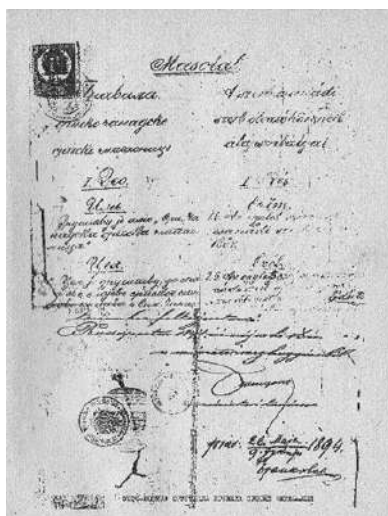
Prima pagină a Statutului întocmit la 26 mai 1894 (întocmit în limbile sârbă și maghiară)

Cenad – o comună bogată în vestul extrem al României de astăzi, fără sate aparținătoare, aflată la granița cu Ungaria și nu departe de granița cu Serbia. Cândva, aici a fost un castru roman. Aici au luat ființă prima mănăstire de pe teritoriul actual al României și prima școală. Aici a ființat Episcopia Romano-Catolică de Cenad. Secole de-a rândul aici au trăit alături români, sârbi, maghiari, germani, pentru a aminti doar naționalitățile cele mai importante. Ecurile iluminismului au pătruns repede în inimile cenăzenilor, astfel că, în cea de-a doua jumătate a secolului al XIX-lea, emanciparea națională a debutat cu înființarea primelor societăți de lectură și casine. Deși ocupația principală a sătenilor era agricultura, iar zilele lungi de iarnă trebuiau folosite cu chibzuință, pătura intelectuală, școlită în principal pe la Buda, Viena, Belgrad sau Novi Sad, a luat inițiativa. Pe lângă alte asociații de profil, de genul celor create de pompieri, reprezentanții fiecărei naționalități s-au străduit să înregistreze biblioteci, săli de lectură și, evident, casine.