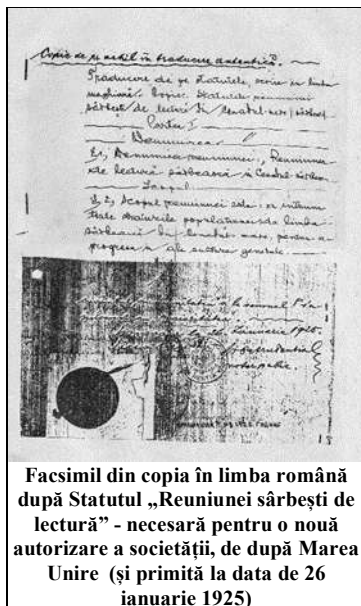
Facsimil din copia în limba română după Statutul „Reuniunii sârbești de lectură” - necesară pentru o nouă autorizare a societății, de după Marea Unire (și primită la data de 26 ianuarie 1925)

cartea „ 100 – Српска Читаоница Чанад – Ис корена ружа цвета ” („ 100 – Sala de lectură sârbească Cenad – Trandafirul înfloarește din rădăcină ”), nu era nicidecum vorba de o instituție ce funcționa pe lângă vreo cârciumă, așa cum se obișnuia pe vremea aceea, ci în propriul local. Așadar, sârbii cenăzeni erau interesați de progresul cultural, ridicarea spirituală comună, cultivarea spiritului de grup, socializarea, păstrarea ființei naționale. Pe sigiliul societății figura chipul Sfântului Sava 2 .