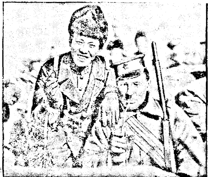
Cliseul acesta reprezintă înfrățirea dintre un soldat din gardă albă rusească și un ofițer chinez.

O telegramă din Riga semnalează o mare depresiune în cercurile guvernaților sovietice, din