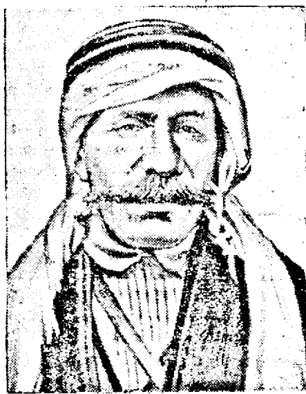
Sultanul El Akrasch, comandantul forțelor arabe plecate spre Palestina, ucis în luptele cu trupele engleze.

pedepse foarte grele pe arabii cari ar încerca să treacă din Transjordania în Palestina.