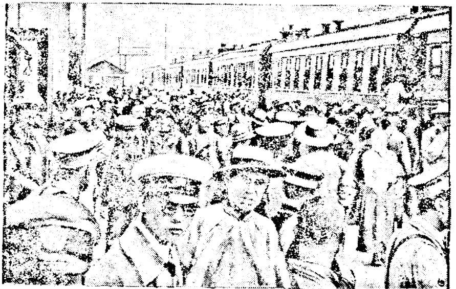
Cliseul nostru reprezintă gara din Maudshuli, luată cu asalt de populația europeană, care se refugiază în interiorul țării, de groaza luptelor și măcelurilor.