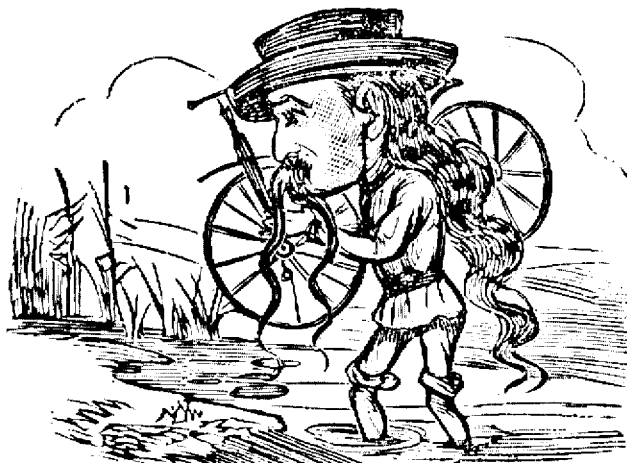
Ajungandu la o balta, fu silitu a luá velocipedulu in spate si a trece pedestru.