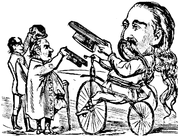
„Gur'a Satului“ plăca la Siomcut'a pe velocipedu.