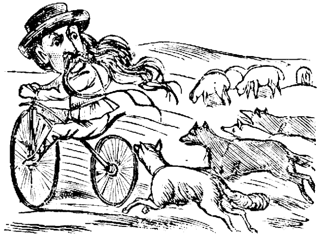
Abié iese din orsiu la campu, canii de la oi toti se luara dupa elu.