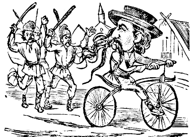
— Éta necuratulu! Haidati sê-lu batemu!