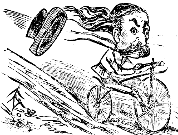
Primesdiós'a coborire de pe unu dealu.