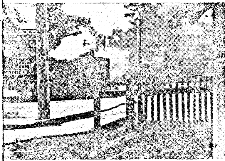
lanț social distruș de către artileria germană pe s'rada unei localități. (Pk. Ob.)