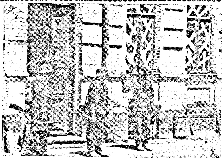
Soldați germani curățând un sat sovietic de resturile armatei bolșevice. Pk. Ob.

valoarea taxelor prevăzute de tariful postal extern. Rămân și în serviciul intern cu tariful nemajorat, următoarele categorii de corespondențe: 1) Corespondența oficială a autorităților. 2) Ziarele. 3) Publicațiile periodice. 4) Imprimările în relief pentru uzul orbilor. 5) Cărți poștale militare. Cărțile poștale militare, vor fi francate tot cu noule timbre, aplicându-li-se însă, taxele prevăzute de tarifele P.T.T. valabile dela 1 Noembrie 1941. Detalii în legătură cu aplicarea noului tarif, pe lunile Decembrie 1941 și Ianuarie 1942 și cari au menirea de a crea un fond special de asistență pentru a face față necesităților impuse de împrejurările actuale excepționale, se pot obține la toate oficiile poștale.