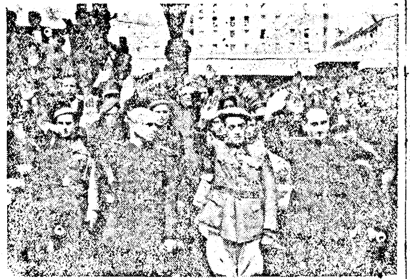
Divizia albastră spaniolă în lupta împotriva comunismului primitiv într'un oraș german.