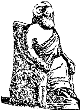
Statuia zeului Baal

EXPLICAȚIUNI: Ghedeon a trăit pe la 1250 înainte de Isus Hristos. Madianii și Amalechii, împreună cu fiii răsăritului, ceea ce înseamnă fiii pustiurilor din răsărit, formau toți