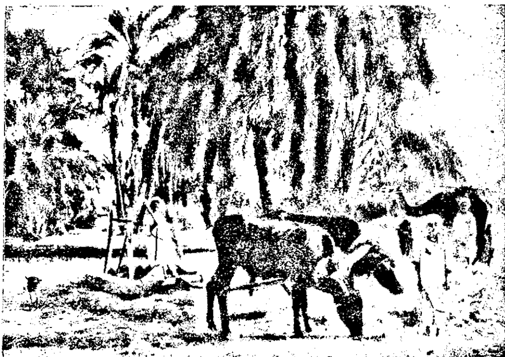
Țara Goșen, în Egipt, unde a fost așezat poporul evreu.