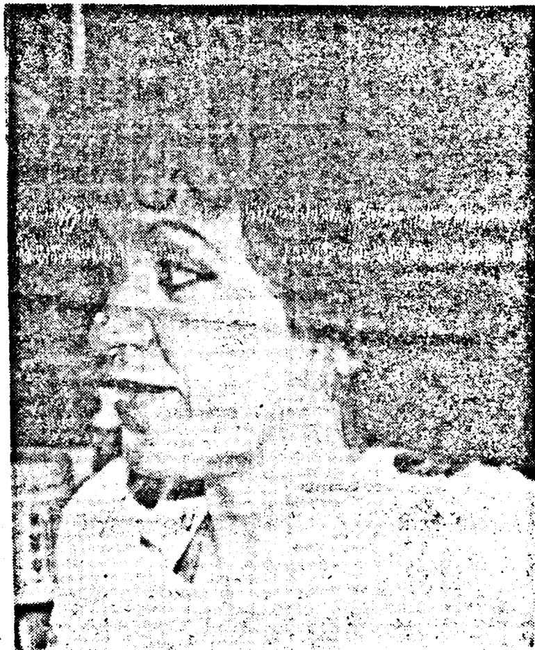
CIȘTIGĂTOAREA CONCURSULUI NOSTRU DUPĂ „O ZI LA SUPER LADY“

Din rîndurile de mai sus, sperăm că v-ați creat o imagine convingătoare asupra posibilităților salonului SUPER LADY de a răspunde celor mai înalte exigențe în materie. Și ați găsit și explicația alegerii sale ca sponsor al concursului nostru. SUPER LADY este un nume care trebuie reținut, pentru că reprezintă o garanție a calității. Nu uitați, pe strada Vasile Alecsandri, salonul de coafură SUPER LADY vă așteaptă!