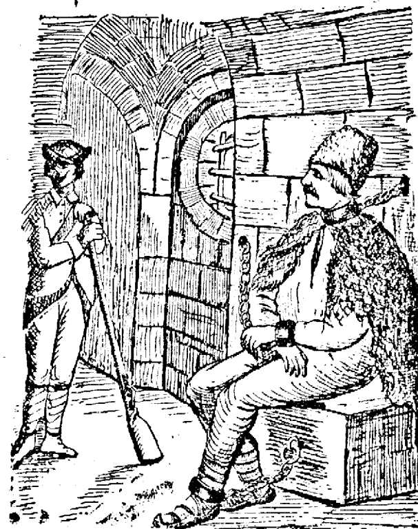
Horea în temnița din Alba-Iulia