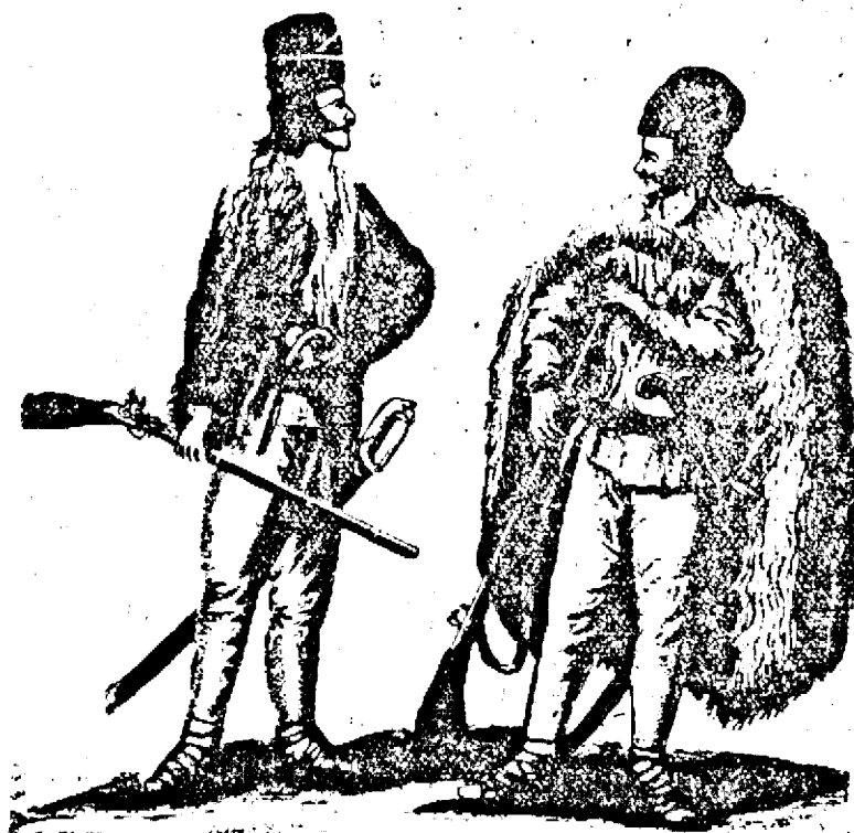
Horea și Cloșca.

În Capitală se va organiza o expoziție cu toate măturile păstrate de istorie în legătură cu revoluția lui Horea.