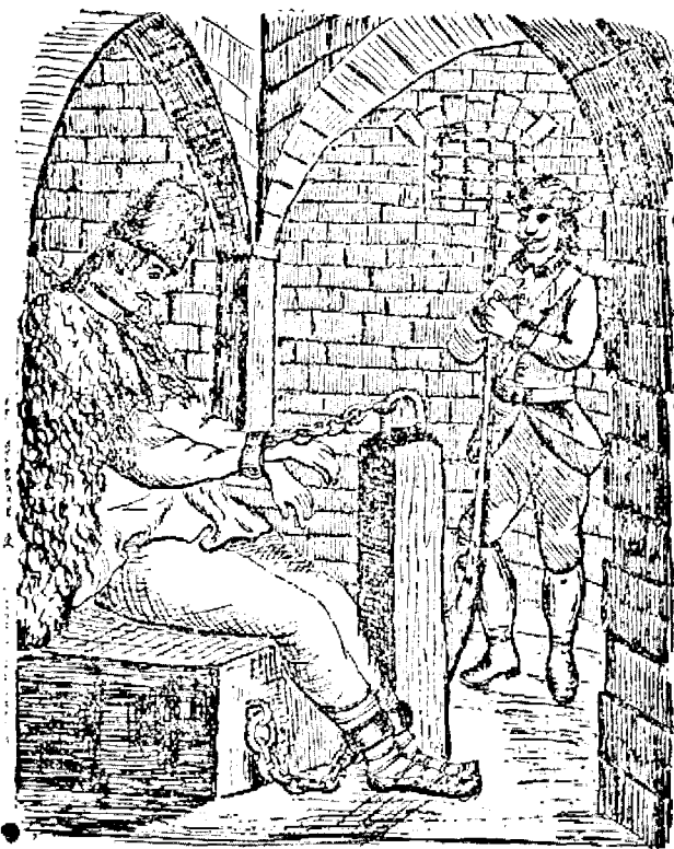
Cloșca în temnița din Alba-Iulia