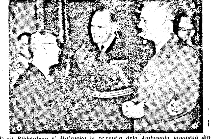
D-nii Ribbentrop și Matsuo la recepția dela Ambasada japoneză din Berlin