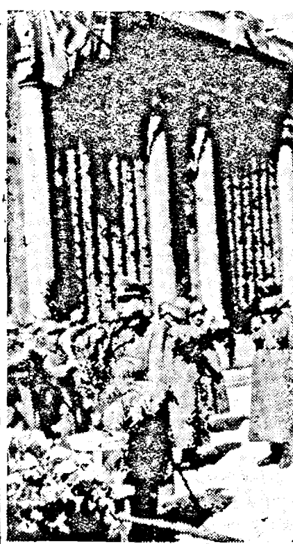
Mareșalul List în fața mausoleului eroilor din Sofia

FONDAT 1906 Meisl & Adler cel mai estin maga- zin de pălării și modă bărbătească ARAD, B-dul. Reg. Maria 24.