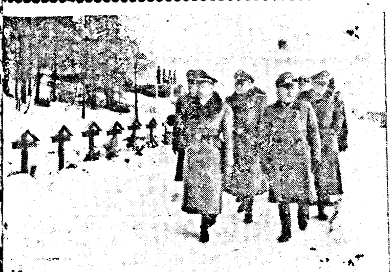
... conducătorul formațiunilor SS germane, și generalul von Falkenhorst vizitând cîmpul militar dela Ekeberg, Oslo.

Pentru completarea ordinului circular trimis prin Inspectoratul Școlar Județean tuturor școlilor primare din jud. Arad, Oficiul de Orientare Profesională Arad, face cunoscut celor interesați următoarele: 1. Școlile primare sunt invitate ca în adresele ce le trimit Oficiului să prezinte și profesunea pe care elevii doresc să învețe. 2. Pentru a-i scuti de mai multe drumuri, toți cei din provincie sunt rugați a se prezenta în fiecare săptămână Marția la orele 8 dimineața, pentru a fi examinați și a putea primi certificatul cu rezultatul examenului psihotehnic, în aceeași zi. Arad, 5 Iunie 1941 Oficiul de Orientare Profesională ARAD