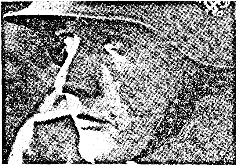
Tip caracteristic de soldat german.