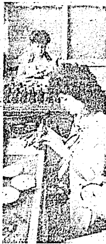
Aspect de muncă în secția (la montaj) a întreprinderii de ceasuri „Victoria”.