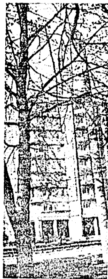
Instantaneu de sezon.