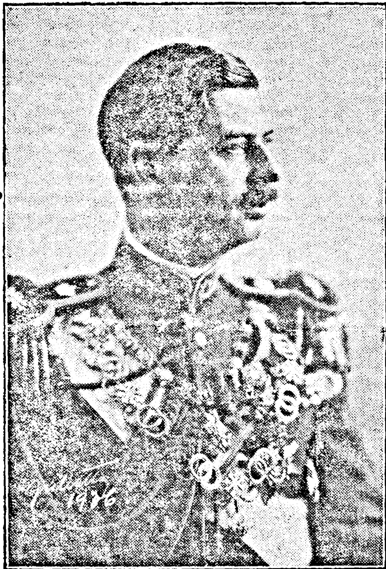
M. S. Regele Carol II.

Pentru aducerea la îndeplinire acestui imperativ național am hotărât, sub președinția Patriarhului României, un Guvern de oameni răspunzătoare, cari, mînați de cel mai desăvârșit patriotism, descălecați fiind de activitatea de parador vor avea tot răgazul să-și în-